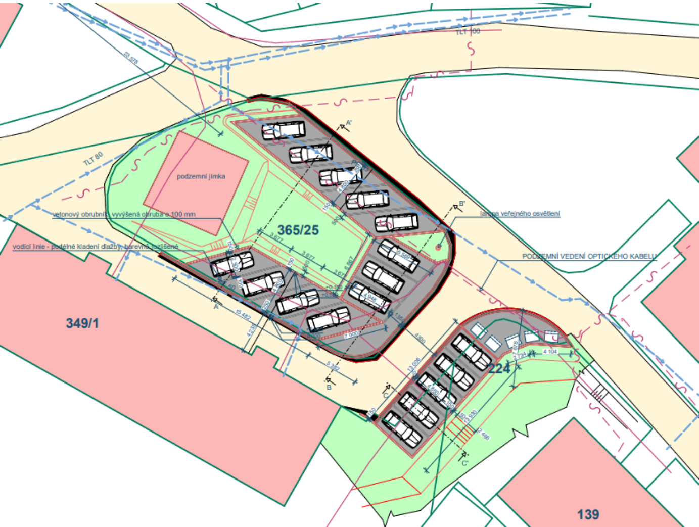
Situace - návrh parkování mezi MŠ a zdravotním střediskem