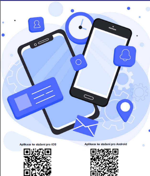
Aplikace ke stažení pro iOS