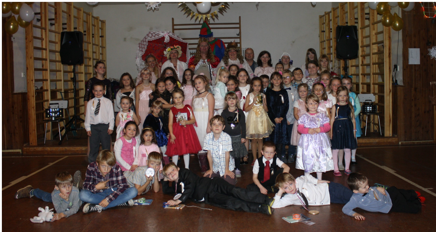
Královský ples pro děti