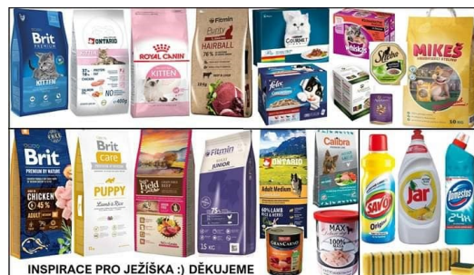
INSPIRACE PRO JEŽIŠKA :) DĚKUJEME