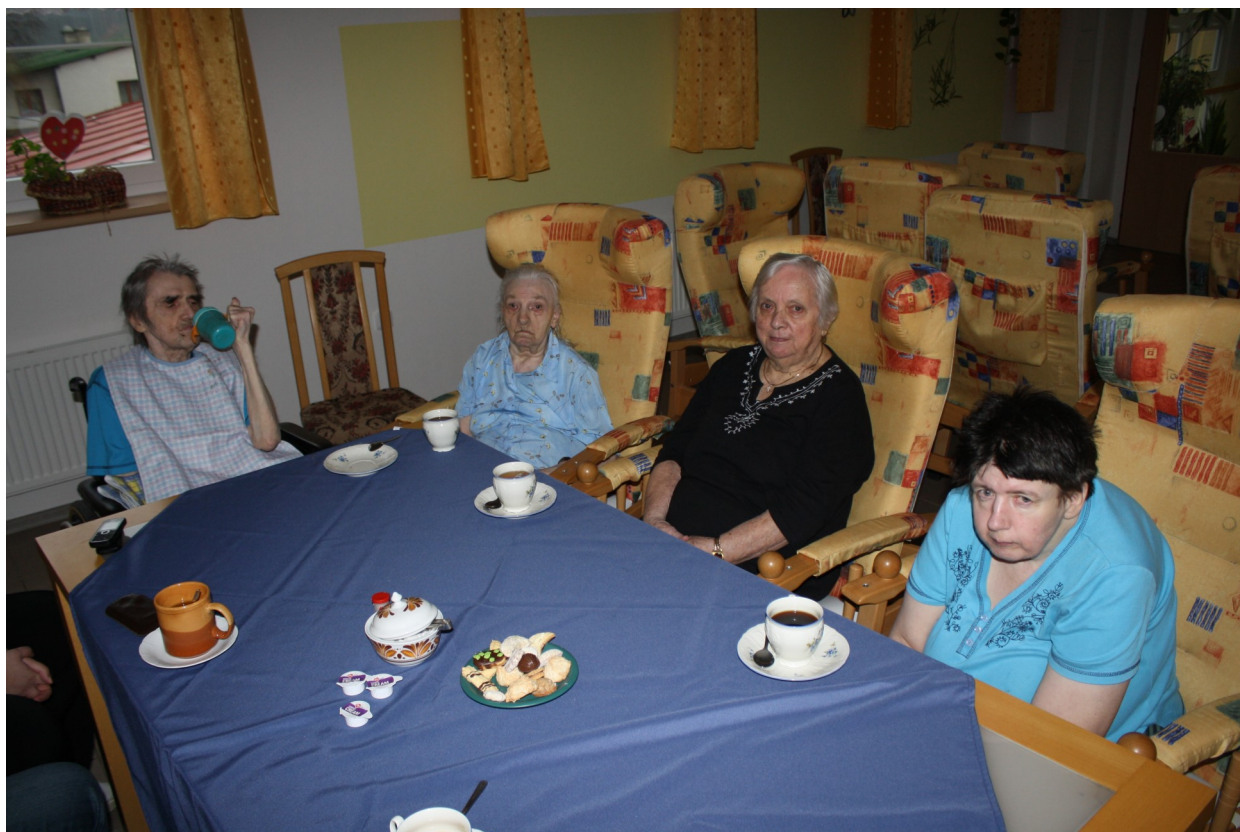
Bernartičtí senioři v Domově důchodců v Lamperticích

Sbor dobrovolných hasičů v Bernarticích zve srdečně všechny děti, mládež i dospělé na tradiční