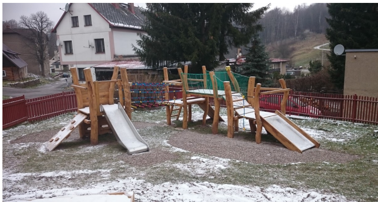
Fotografie části nového EKO hřiště u mateřské školy.