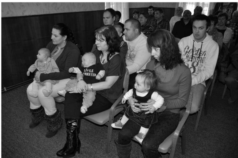
Foto z vítání občánků ze dne 10. ledna 2015