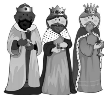
Foto bernartických dětí z tříkrálovské sbírky