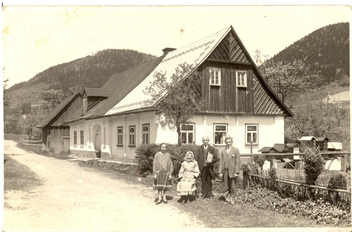
Fotografie domu v Bečkově (Potschendorf Nr. 32), majitele Friedricha Hartela, který se živil jako zedník. V dnešní době již dům nestojí, fotografie pochází z 30. let minulého století.

Všem jubilantům srdečně blahopřejeme a do dalších let přejeme hodně zdraví, spokojenosti a životního optimismu.