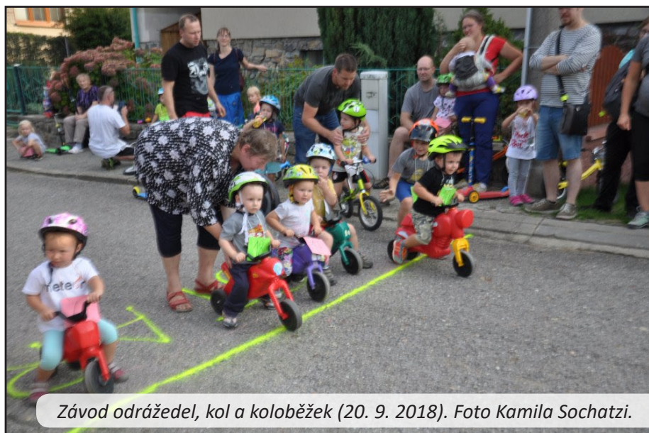
Závod odrážedel, kol a koloběžek (20. 9. 2018).