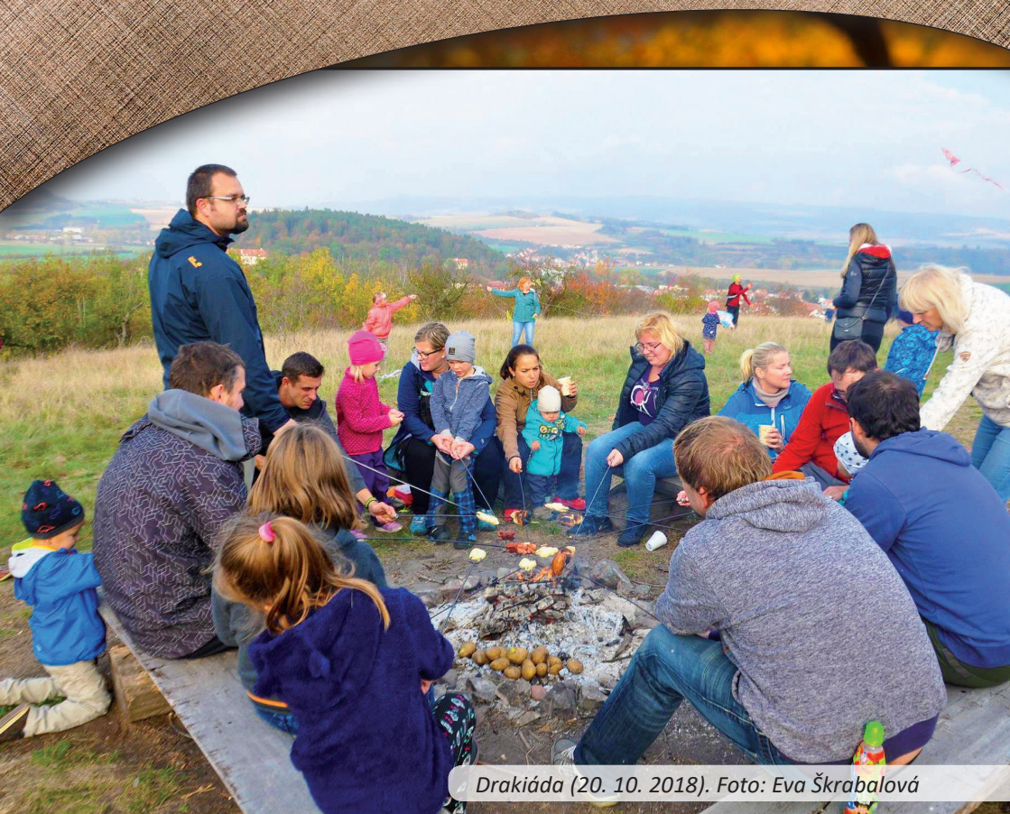
Drakiáda (20. 10. 2018).