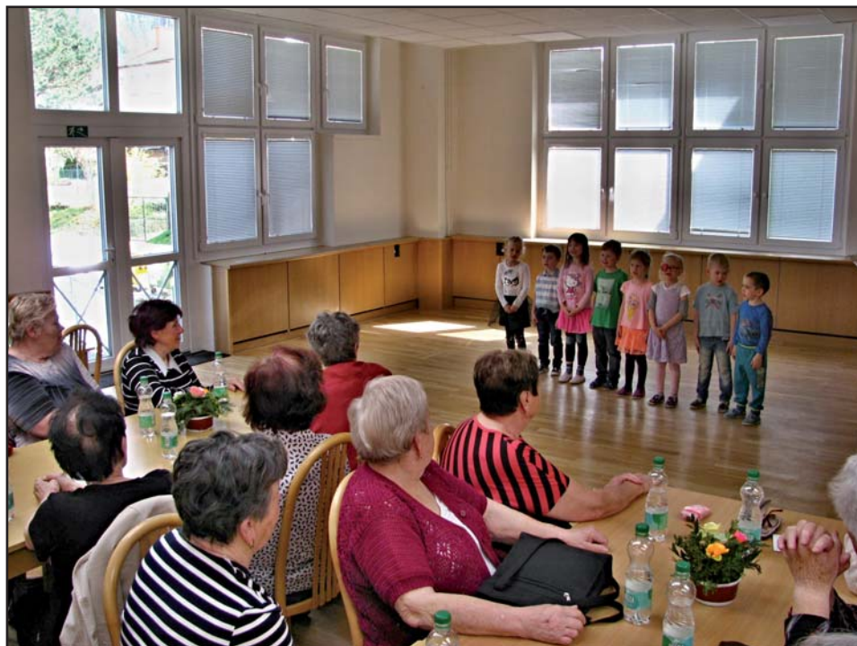
Text a foto: D. Hrachovina