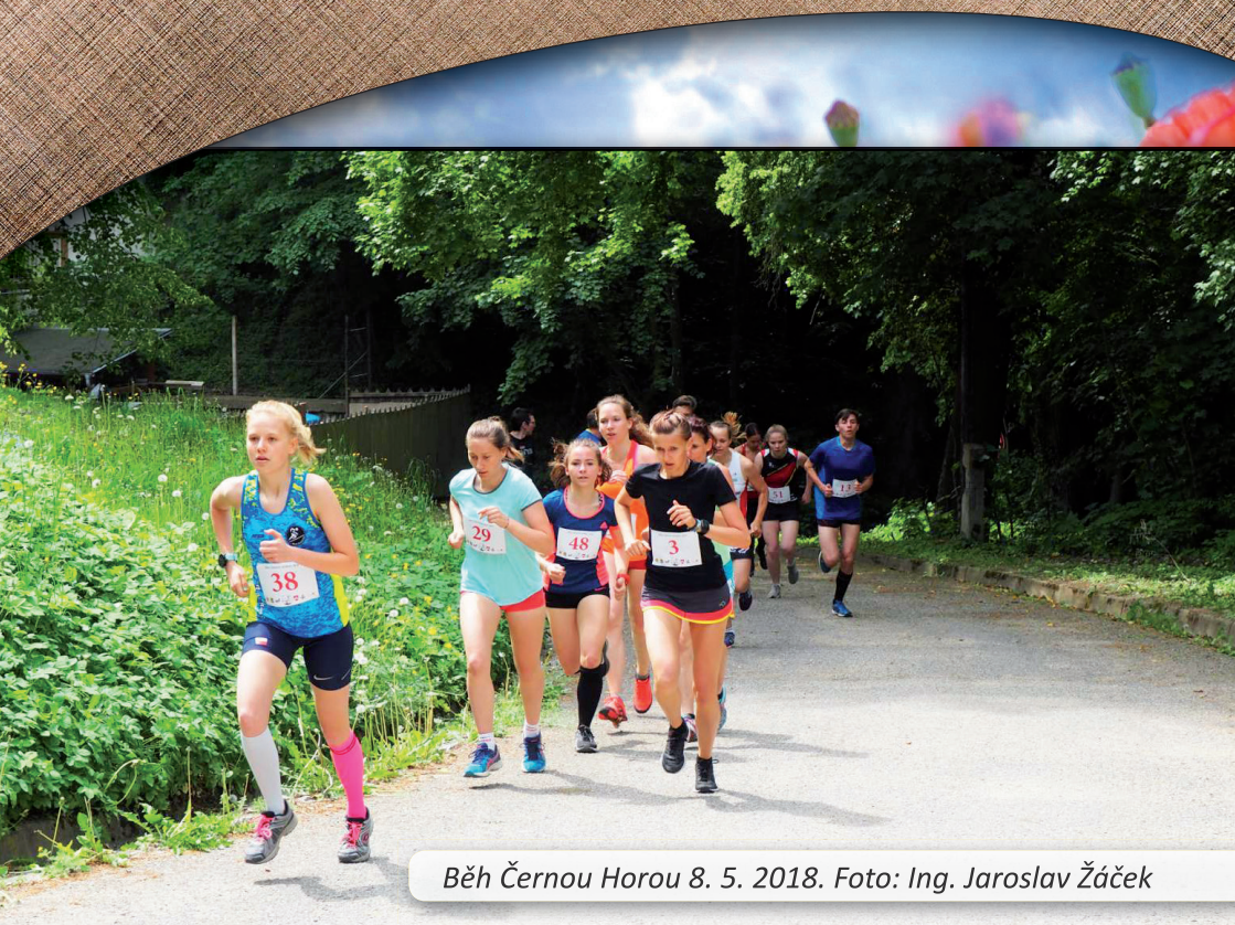
Běh Černou Horou 8. 5. 2018.