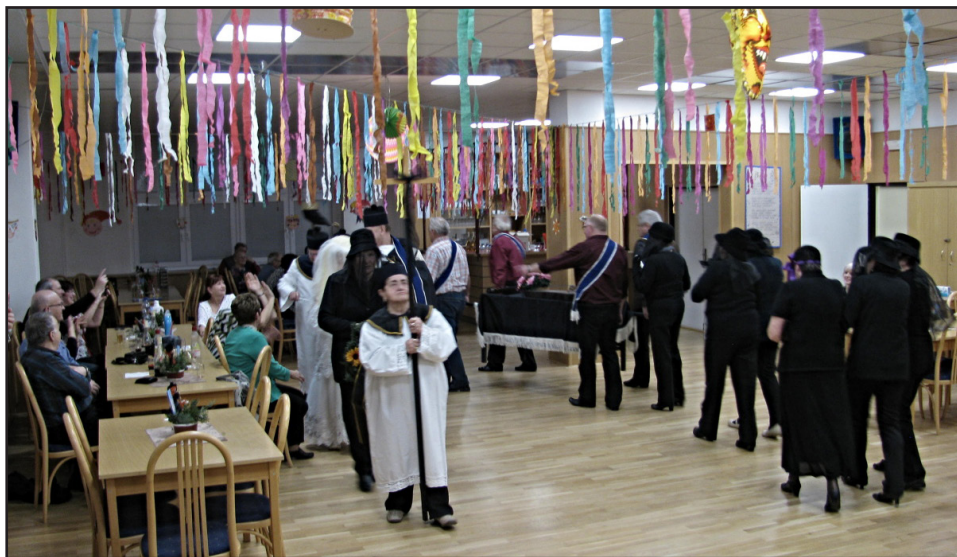
Text a foto: D. Hrachovina

Dík organizátorům z řad SZP za přípravu programu a dohled nad průběhem večera.