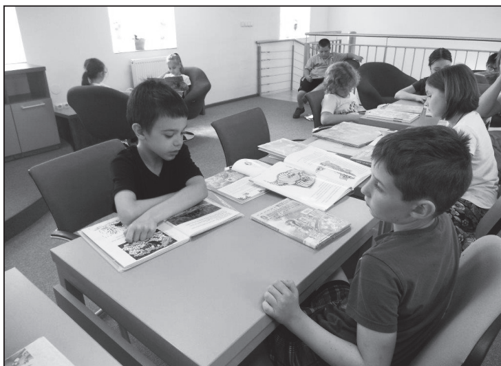
Beseda s žáky 2. B na téma ilustrátoři dětských knih.

Katalog knihovny: http://knihovna.cernahora.eu/