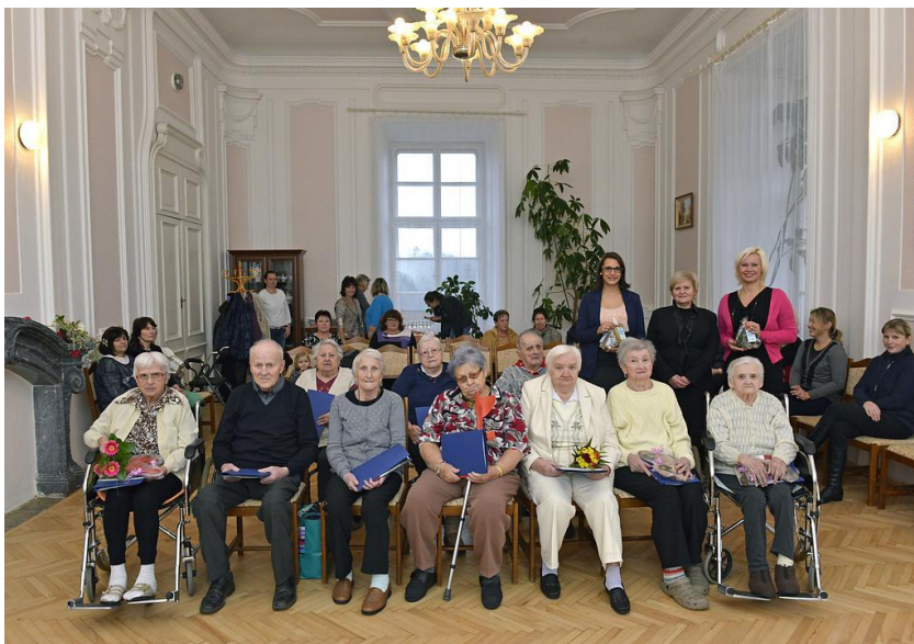
Text a foto Mgr. Jana Kaderková

Že je studium a vzdělávání se jen pro mladé? Svě o tom ví naši senioři, kteří se koncem loňského roku zúčastnili projektu Univerzity třetího věku pod záštitou Masarykovy univerzity. Znamená to, že se zapojili do programu celoživotního vzdělávání určeného právě pro osoby v postproduktivním věku. Výuka s lektorkami probíhala přímo u nás v domově. Obsahem kurzu byla témata věnovaná např. procvičování paměti, osobnosti ve stáří, relaxačním technikám, kvalitě života nebo duševní hygieně. Účastníci tak měli příležitost vymanit se z běžného života v domově, zavzpomínat na svá studentská léta, společně se setkávat a prohlubovat své znalosti. Kurz byl ukončen slavnostním předáváním diplomů všem absolventům, u kterého nechyběli lektorky kurzu, rodinní příslušníci seniorů ani zaměstnanci domova.