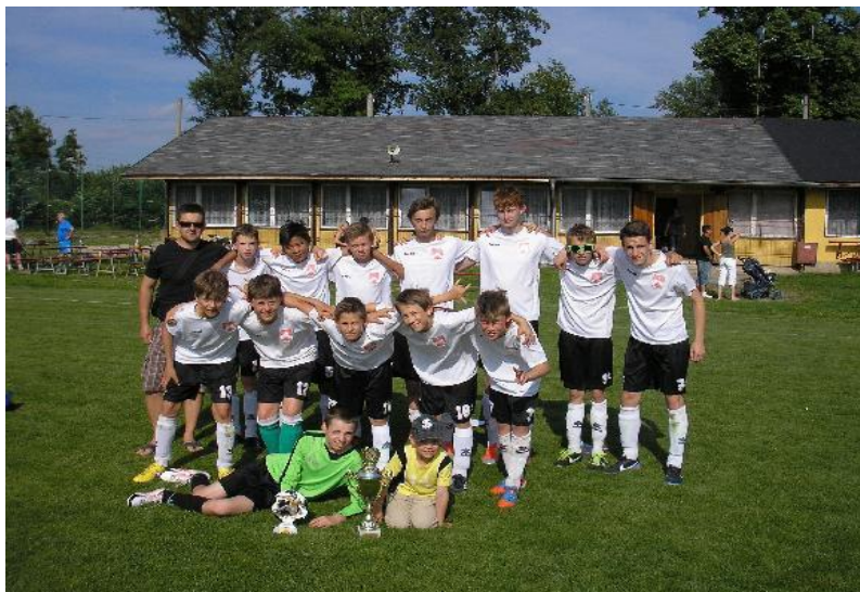
Družstvo starších žáků, vítěz VI. ročníku MEMORIÁLU PANA JAROSLAVA MIHOLY ve Svitávce 15. 6. 2013

V současné době v našem klubu působí čtyři mládežnická družstva. Mladší a starší přípravka, starší žáci a dorost, celkem 49 kluků od předškolního věku až po dospělost. Po posledním náboru je vidět zvýšený zájem mládeže v Černé Hoře a okolí o fotbal. Oceňujeme materiální podporu Městyse Černá Hora a dalších sponzorů z řad místních podnikatelů, která klubu pomáhá řešit chybějící prostředky. Problémem zůstává zajištění kvalifikovaných trenérů u všech mládežnických týmů. Rádi bychom touto cestou oslovili zájemce, kteří by nám s prací s mládeží pomohli a nevdálo by jim sebevzdělávání v oblasti fotbalového sportu. Nejedná se jen o trenéry a jejich asistenty, ale i o technickou pomoc při zápasech apod. Práce s mládeží je velmi náročná, neradi bychom ztratili návaznost týmů v mládežnických soutěžích, kterou se podařila po delší době opět vybudovat.