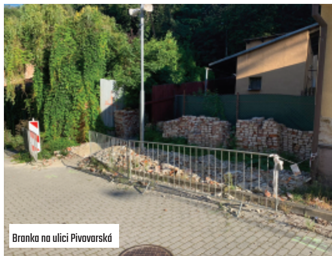
Branka na ulici Pivovarská

Toto se děje v závislosti na fázi noci. Zejména ale je to způsob osvětlení, který živým organismům vrací možnost přirozeně vnímat plynutí času, žít nám více udržitelně, ohleduplně k ostatním živým tvorům, v souladu s přírodou[1].