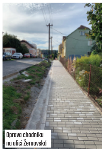
Oprava chodníku na ulici Žernovská

V tomto měsíci byla zahájena i oprava chodníku na ulici Žernovská a začala montáž nového rozhlasu v rámci projektu "Protipovodňová opatření městyse Černá Hora".