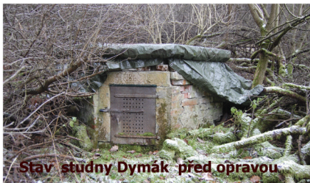
Stav studny Dymák před opravou