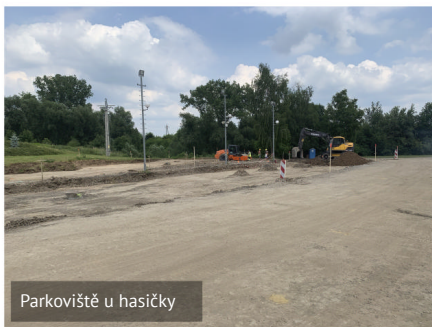
Parkoviště u hasičky

Hovoříme o „Parkovišti u hasičky“, kde práce jsou již v plném tempu. Kontrolní dny probíhají každý týden a řeší se nastalé situace. Jednou z nepříjemností je, že při statické zkoušce únosnosti zemní pláně byly zjištěny údaje nevyhovující pro realizaci stavby. Proto musí dojít k úpravě této aktivní zóny tak, aby stavba byla stabilní a kvalitní. Toto samozřejmě s sebou nese i navýšení ceny, která bude vyšší minimálně o cca 1 mil. Kč dražší. Bohužel bez této úpravy by zhotovitel nemohl v práci pokračovat. Během června byla položena dešťová kanalizace a byl proveden odkop terénu na stavební plán. V červenci proběhne stabilizace pláně a začnou se usazovat obrubníky. Konec akce je naplánován na konec září 2021.