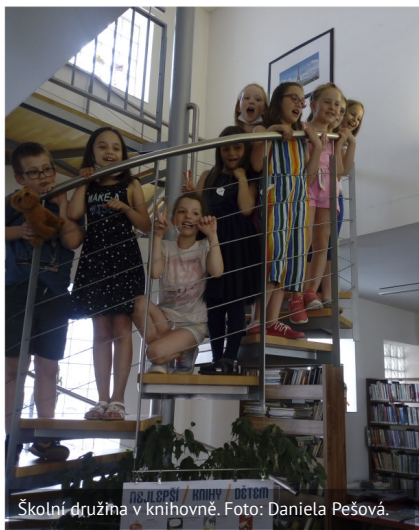
Školní družina v knihovně.