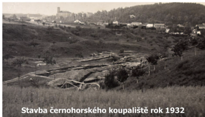
Stavba černohorského koupaliště rok 1932

V roce 1997 začaly opravy dna, které bylo nově odvodněno. Potok Žerotínka, tekoucí kolem bazénu koupaliště byl uložen do rour (zatrubnění potoku) o průměru 60 cm. Zatrubnění potoka Žerotínka bylo z hlediska legislativního stavba nepovolená, kdy nebyly dodrženy žádné příslušné zákony, předpisy a vyhlášky.