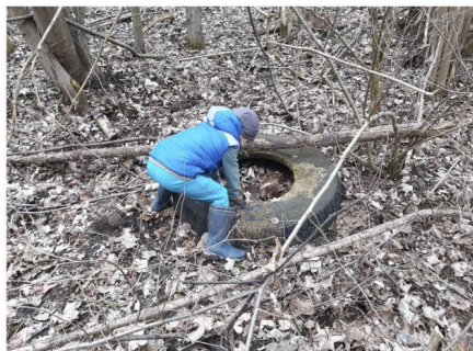
Text a foto: Martin Chovanec