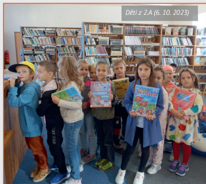
Děti z 2.A (6. 10. 2023)