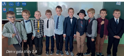
Den v gala třídě 1.A