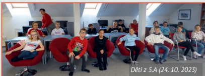
Děti z 5.A (24. 10. 2023)