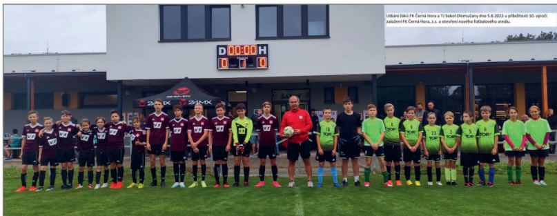
Utkání žáků FK Černá Hora a TJ Sokol Olomučany dne 5.8.2023 u příležitosti 10. výročí založení FK Černá Hora, z.s. a otevření nového fotbalového areálu.