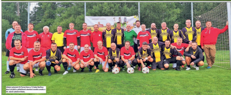
Utkání veteránů FK Černá Hora a TJ Sokol Bořitov dne 5.8.2023 u příležitosti otevření nového areálu a 10. výročí založení klubu.

Děkujeme tímto Pivovaru Černá Hora, městyši Černá Hora a Reznictví a uzenářství Havlíček za podporu, a všem, kteří nás i přes nepříznivé počasí přišli podpořit. Těšíme se na Vaši účast při podzimních domácích zápasech našeho klubu.