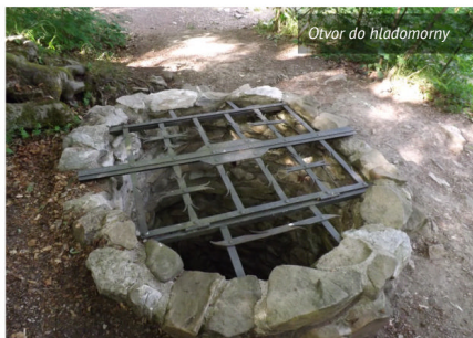
Otvor do hladomorny

Přepadl ji zlolajný Vok a unesl na svůj hrad. Nešťastnou Bětku uvrhl do hladomorny pod hradem a mladou Anežku nutil, aby mu byla po vůli. Sliboval, že když si ho vezme propustí její matku. Zoufalá Anežka svolila k sňatku, aby tak zachránila svoji mámu z trýznivého vězení. Avšak Bětka v hladověni žalář zemřela. Vynucená úmluva nemohla být naplněna. To se stalo v nepokojných husitských časech.