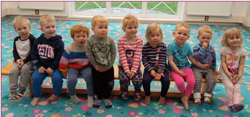
Váš tým Berušek

Věříme, že to pochopíte. Přejeme Vám krásný červen.