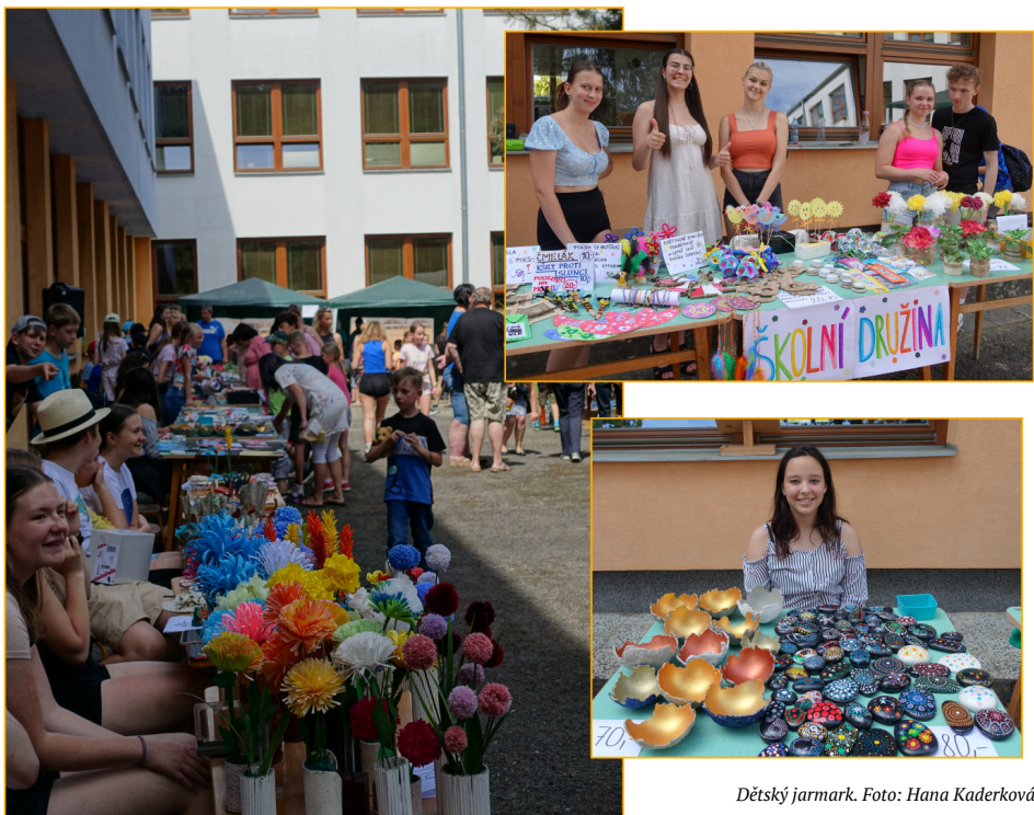
Dětský jarmark.

Přijměte upřímnou soustrast ve Vašem hlubokém zármutku.