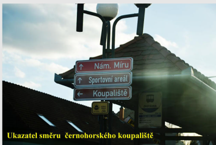
Ukazatel směru černoohorského koupaliště

Zajímavější ukazatel je směrovka u autobusové zastávky, informující: tímto směrem (doleva, pro návštěvníky přijíždějící např. z Rájce nebo z Blanska, kteří se již nabažili blanenského koupaliště) je koupaliště v Černé Hoře. Když se nad tím člověk zamyslí, je to zajímavá směrovka. Co asi tím chtěl zadavatel říct, když dnešní aktuální stav „koupaliště“ zná...Dále bez komentáře. Možná, že by nebylo od věci vyvěsit pod touto směrovkou návštěvní řád koupaliště (kopii lze vzít z webových stránek obce Černá Hora).