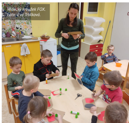
Vědecký kroužek FOX.

Pravidelné setkávání v respektujícím kruhu žen a dětí. Pokaždé s možností individuální konzultace. Pokaždé s dětmi a pokaždé na jiné téma. Příspěvek centru 50 Kč. Není nutná rezervace předem.