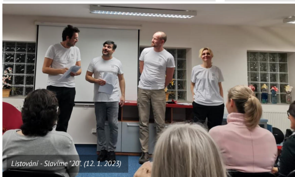
Listování - Slavnost "20". (12. 1. 2023)