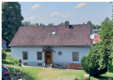
Dolní mlýn, dnešní Chalupa Černohorka

Jana Kubelková. Zdroj: Databáze vodních mlýnů | Vodnimlyny.cz