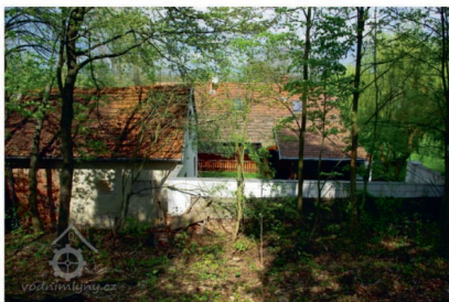
Prostřední, Oborský mlýn

„Bílá sukně nedělá mlynáře.“ ( holandské přísloví ) „Žádný mlynář nemá dost vody a žádný ovčák dost louky.“ ( německé přísloví ) „Více než drahý kámen v prstenu je člověku užitečný mlýnský kámen.“ ( štyrské přísloví ) „Na mlýn dva mlýnské kameny, k přátelství dvě srdce.“ ( turecké přísloví )