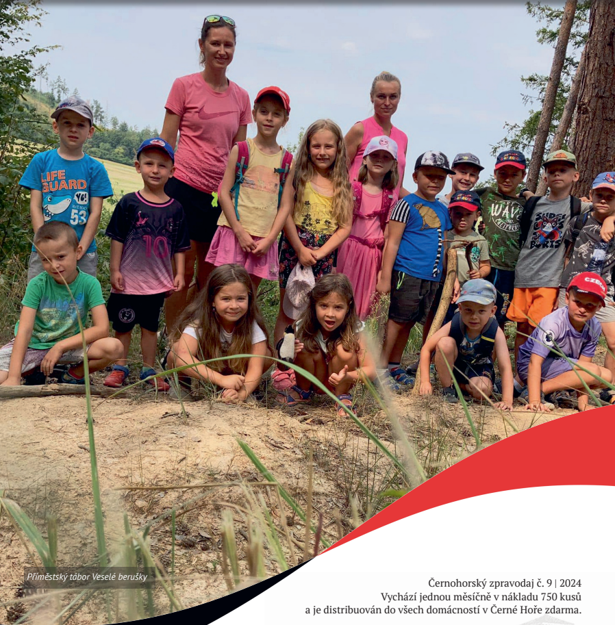
Příměstský tábor Veselé berušky