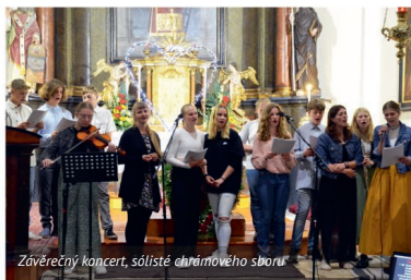
Závěrečný koncert, sólisté chrámového sboru