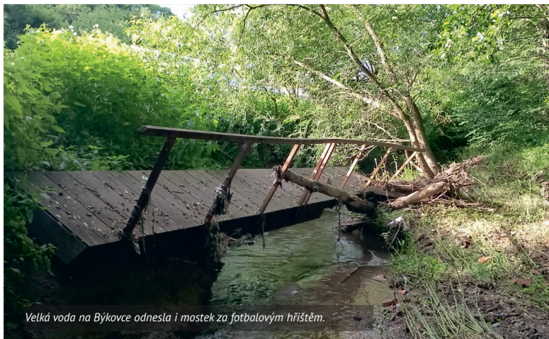
Velká voda na Býkovce odnesla i mostek za fotbalovým hřištěm.

Přijměte upřímnou soustrast ve Vašem hlubokém zármutku.