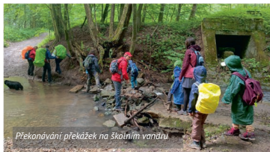
Překonávání překážek na školním vandru

učíme důležitosti tzv. work-life balance. Především totiž věříme, že jsou to právě tyto zážitky a situace, které v dětech posilují schopnost přizpůsobit se, improvizovat, rychle se rozhodovat, přicházet s nápady a řešeními, analyzovat a pojmenovat potenciální rizika, překonat nepohodlí, nevzdávat se a domluvit se s ostatními bez ohledu na jejich věk, zkušenosti nebo rozdílné životní názory.