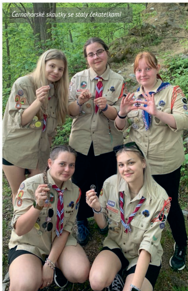
Cernohorské skautky se staly čekatelkami

Pět členek našeho oddílu, včetně mě, složily úspěšně zkoušky a tím dokončily čekatelský kurz. Čekatelská zkouška je interní skautská kvalifikace pro spoluvodoucí skautských oddílů ke zvýšení jejich organizačních, pedagogických a dalších kompetencí. Obsahem jsou myšlenkové základy skautingu, dovednosti potřebné pro organizaci skautského programu a technické dovednosti, například základy bezpečnosti, zdravotvědy, práva nebo hospodaření. Často se využívá metod zážitkové pedagogiky. Uchazeči musí být alespoň 15 let a umožňuje absolventovi staršímu 18 let působit jako zástupce vedoucího skautského tábora.