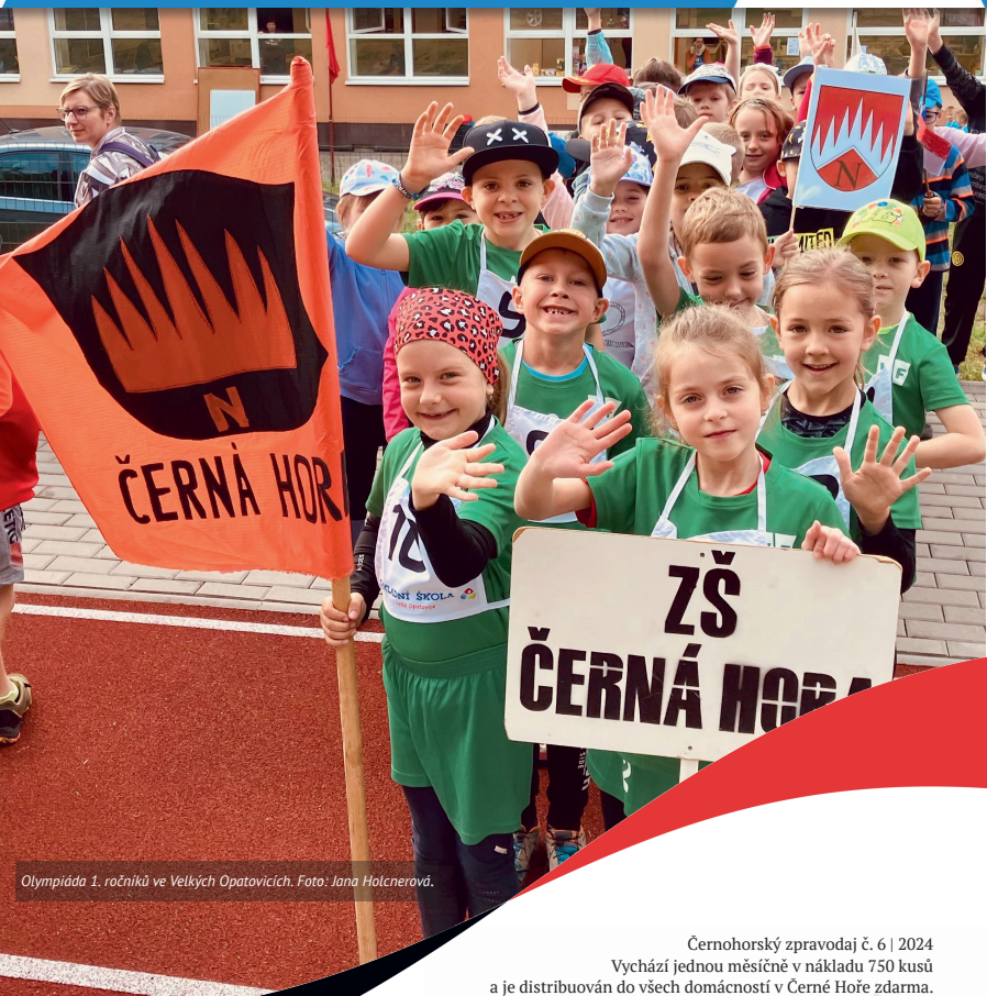
Olympiáda 1. ročníků ve Velkých Opatovicích.

Černohorský zpravodaj č. 6 | 2024 Vychází jednou měsíčně v nákladu 750 kusů a je distribuován do všech domácností v Černé Hoře zdarma.