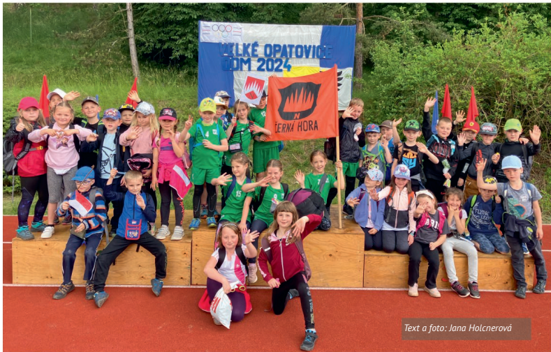
Text a foto: Jana Holcnerová

Olympiáda byla zpestřena pohádkovou cestou se zábavnými aktivitami, počasí nám přálo a tak jsme si ji všichni společně moc užili.