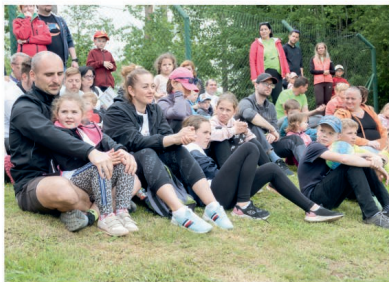
Za pořadatele Jana Kubelková.