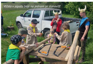
Vličata v zápalu boje na jednom ze stanovišť

Týmy společně poznávaly významné osobnosti, stromy a zvířata, ale třeba i připravovaly jídlo, prokazovaly svoji fyzickou zdatnost, znalost pomoci raněným, třídění odpadků, řešení šifer v podobě sudoku a hledání rozdílů. Další stanoviště obsahovala dovednosti jako je zatlučení hřebíků, řezání dřeva a rozdělování ohně. Naše týmy si nejlépe vedly u vyhledávání informací. Po projití a úspěšném splnění všech úkolů na děti čekal výborný oběd, řízek s bramborem. Následně účastníci vyrazili na prohlídku starého mlýna, který je ovšem moc nenadchl. Na závěr dne proběhlo celkové vyhodnocení, kde se všichni dozvěděli, že je Bezzubka vyléčena.