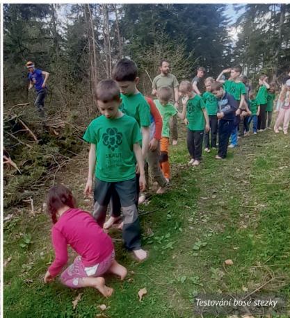
Testování bosé stezky