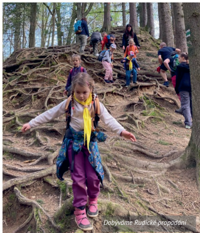
Dobýváme Rudické propadání