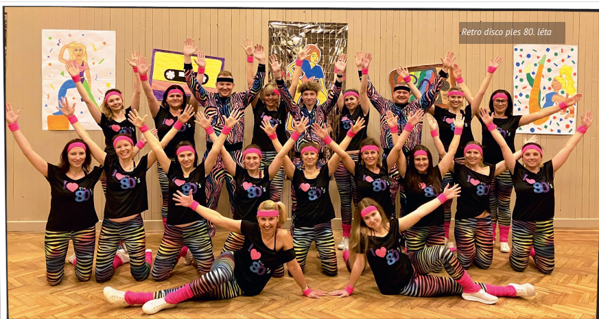
Retro disco ples 80. léta