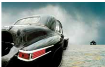
Andreas Budai, EFIAP/G, Black house / Černý dům, Italy / Itálie