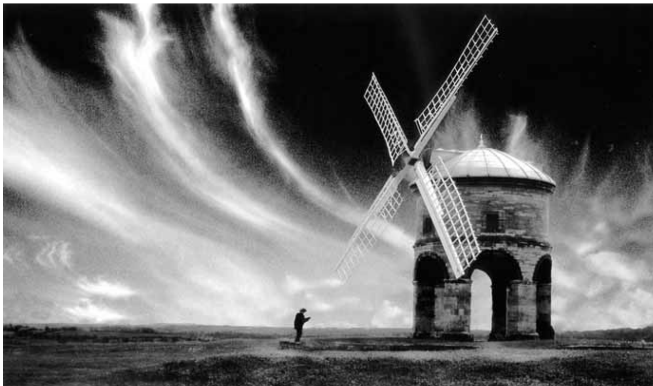
Chesterton Mill / Mlýn v Chestertonu