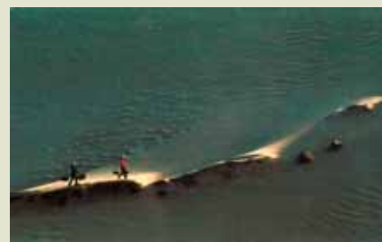
Hoang Trung Thuy, Comming home / Návrat domů, Vietnam / Vietnam