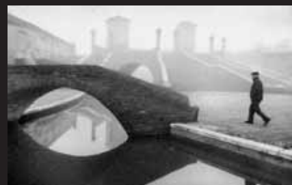
Shadows in the fog 1 / Stíny v mlze 1