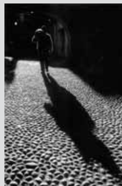
> > Peter Rees, FRPS, EFIAP, MPAGB , Wintry weather / Zimní počasí, England / Anglie