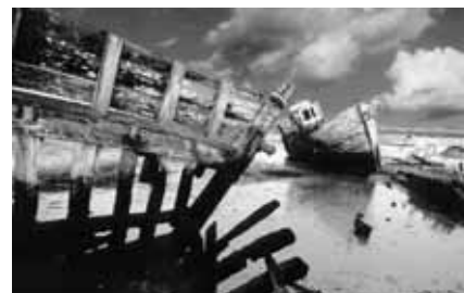
Alain Garsia, AFPF, Agonie, France / Francie