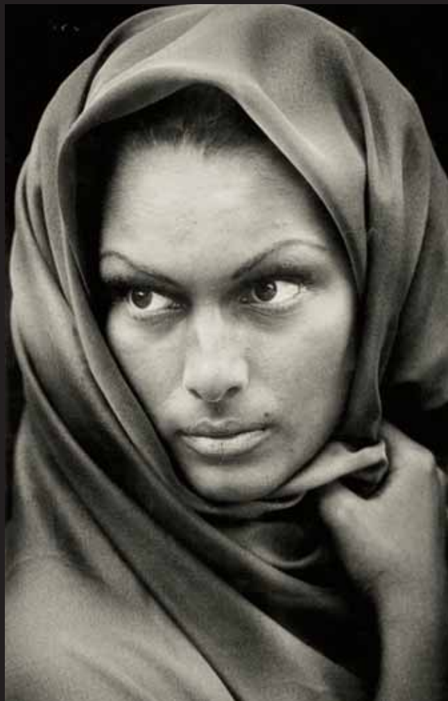
Ferenc Molnar, AFIAP, Tearful madonna / Plačící madonna