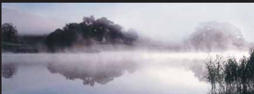
Eileen Rees, Morning mist / Ranní mlha, England / Anglie