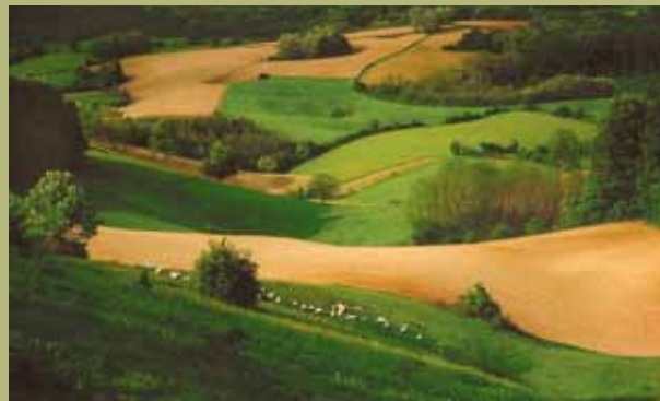
Vladan Tanaskovic, Flock / Stádo