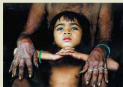
Thai Thanh Nien, Eyes and hands 1 / Oči a ruce 1, Vietnam / Vietnam