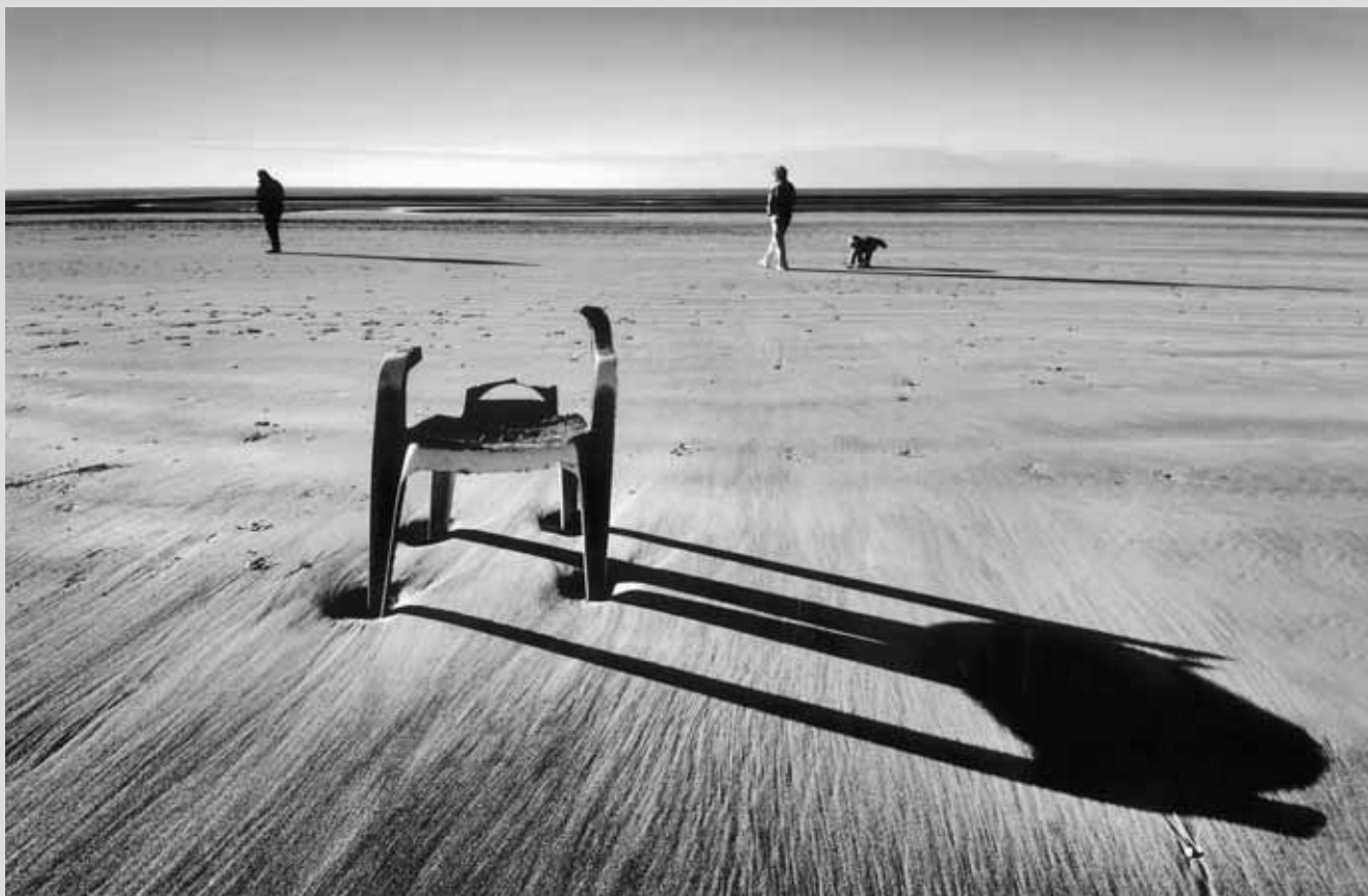
Maurilio Teso, ARPS , Old chair at camber sands / Staré křeslo na pláži, England / Anglie