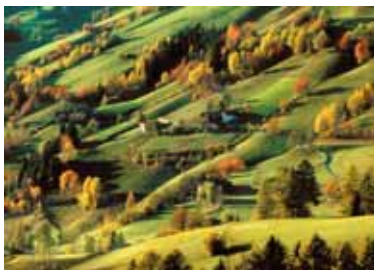
Herbert Fitz, EFIAP / s, Touch of Autumn / Dotyk podzimu, Austria / Rakousko