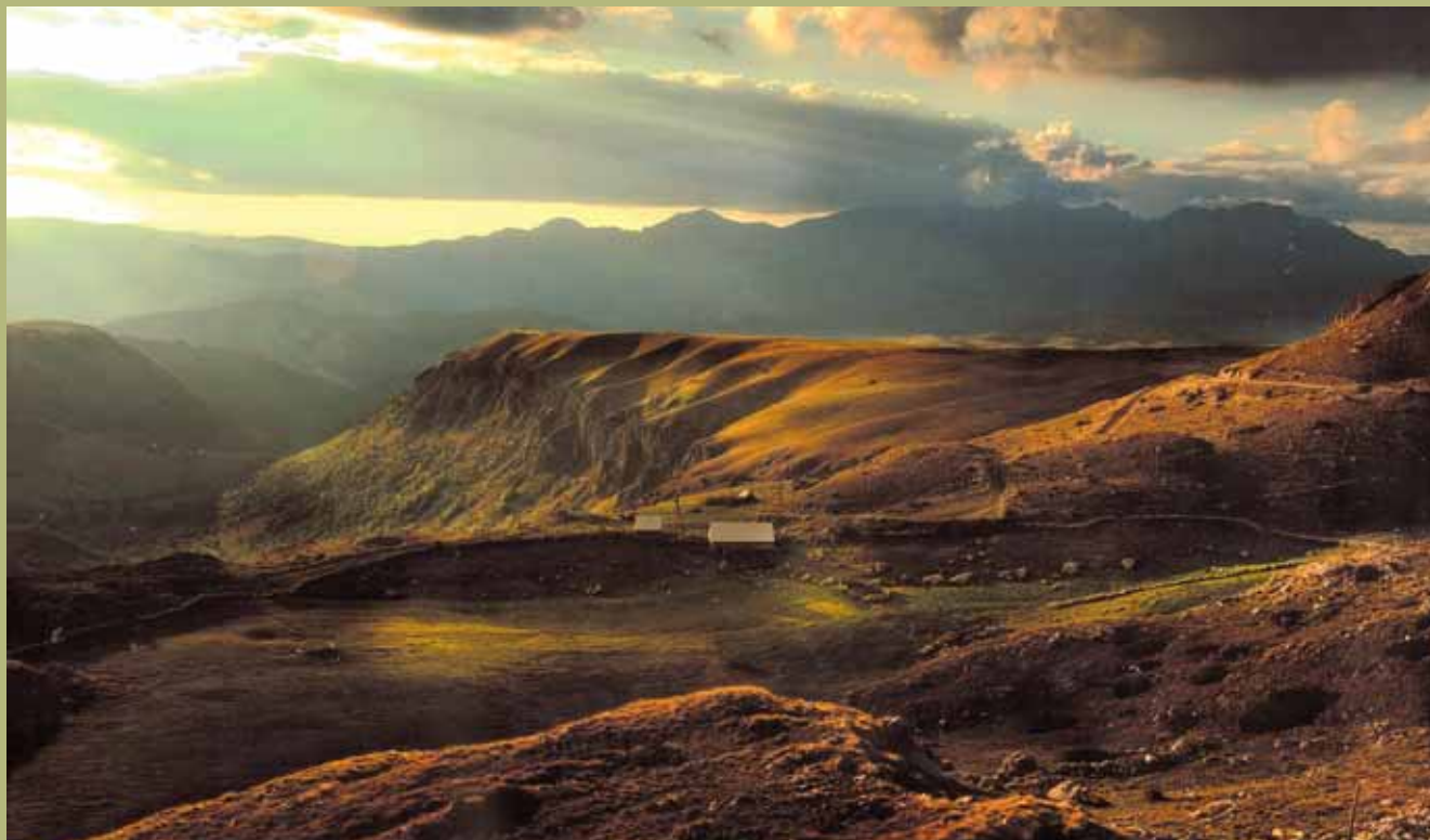
Miroslav Jeremic, Mountain Durmitor 4 / Pohoří Durmitor 4