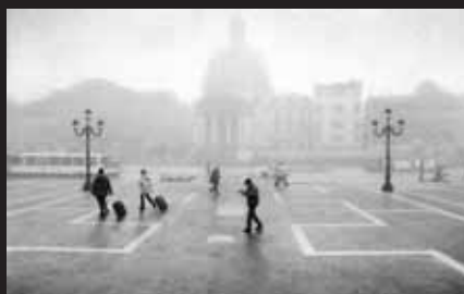
Shadows in the fog 3 / Stíny v mlze 3