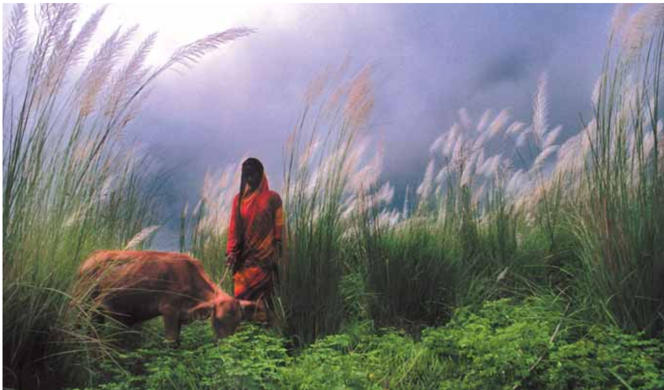
Supriya Biswas, Mortal woman / Vážná žena

>Supriya Biswas, Grandmother's love / Babiččina láska