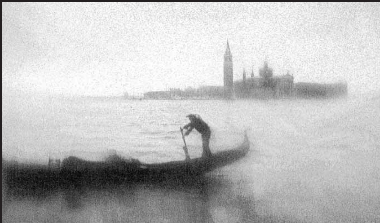
Shadows in the fog 4 / Stíny v mlze 4

Giuseppe Tomelleri, EFIAP, Italy / Itálie