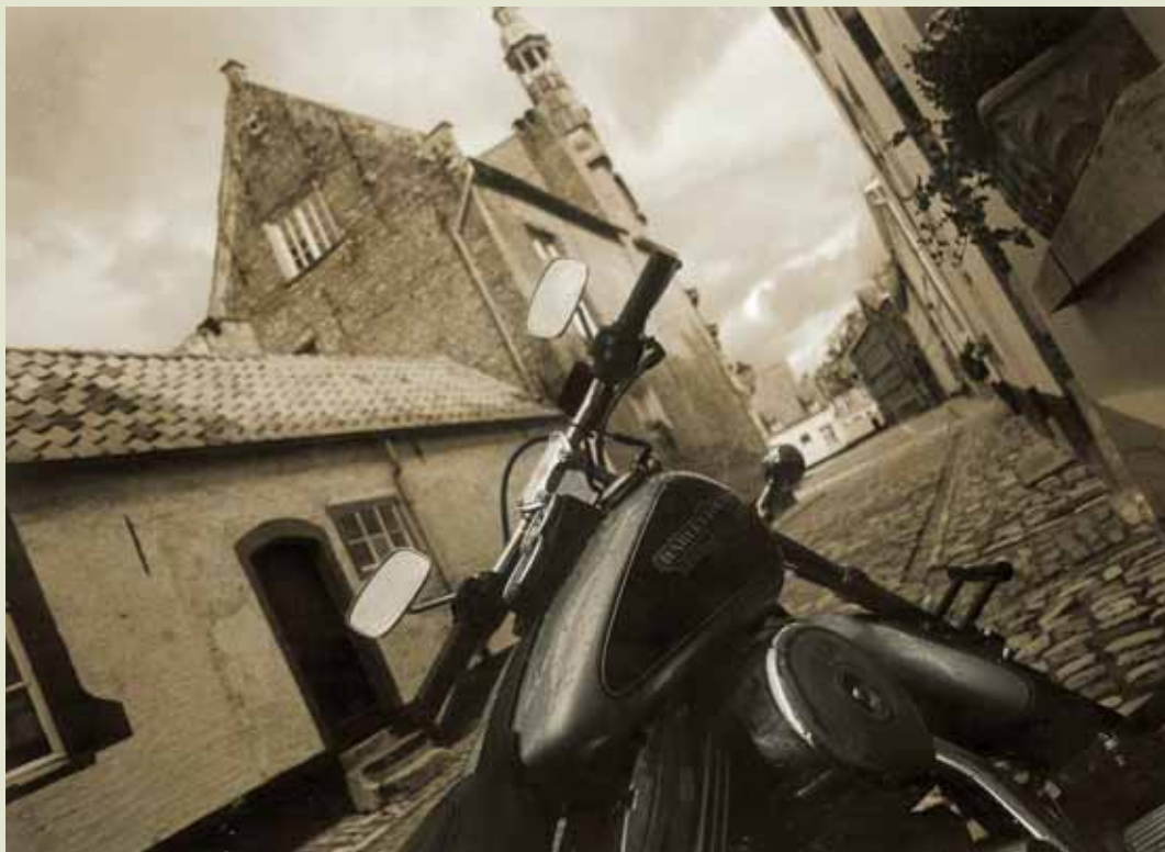
Bob Ceusters, Easy rider / Bezstarostná jízda