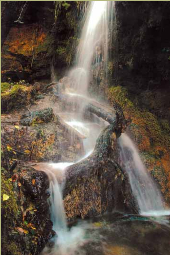
Marko Tanaskovic, Waterfall 1 / Vodopád 1