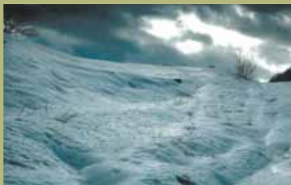
Predrag Miloradovic, Snow / Sníh