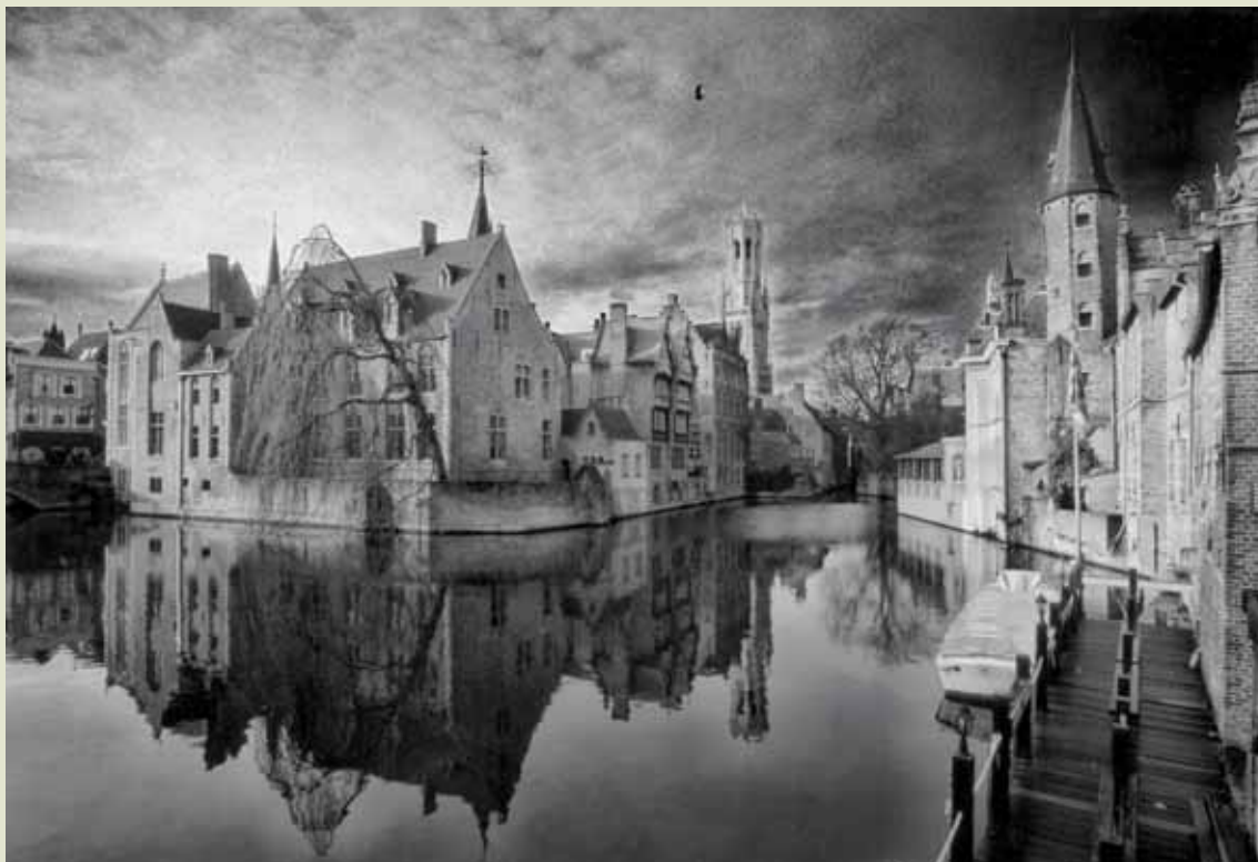
Ignace Vermaelen, Stadsgezicht in Brugge / Tvář města Brugge