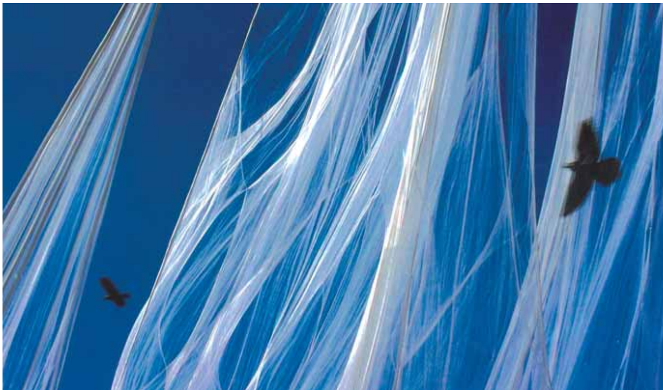
Pius Sali, Gefangen / Lapený

CAMERA 66 - BAD CANNSTATT, Germany / Německo