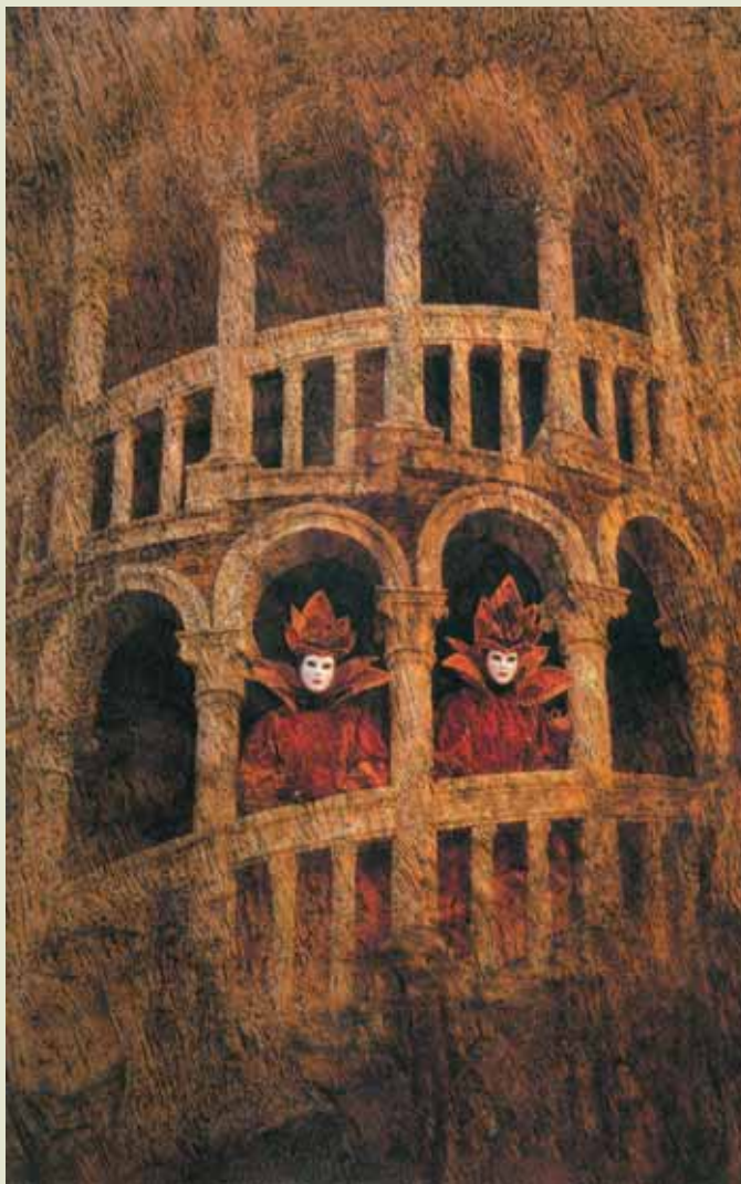
Wooden staircase - 1 / Dřevěné schodiště - 1