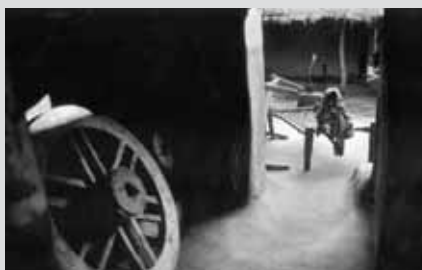
Arup Haldar , Have a look / Omrknutí , India / Indie