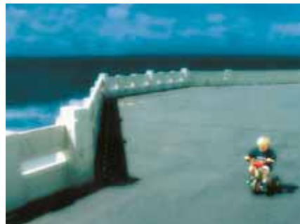
Rudy Somers, EFIAP, Cyklist / Cyklista