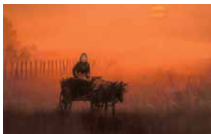
Miklós Juhász, EFIAP, Foggy morn / Ráno v mlze