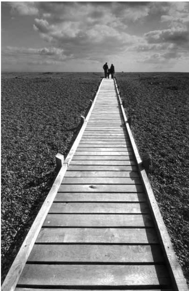
Maurilio Teso, ARPS, Path to the seashore / Cesta na pobřeží, England / Anglie