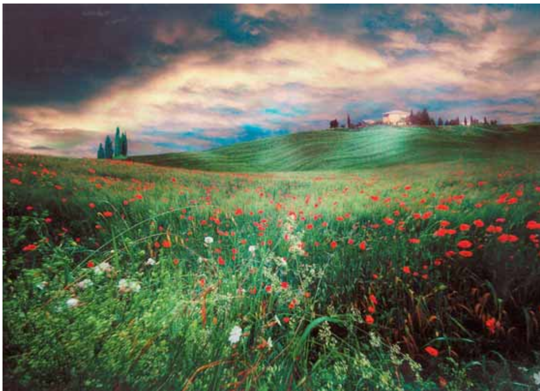
Josef Palfrader, Toscanam, Austria / Rakousko

HONORABLE MENTION FIAP / ČESTNÉ UZNÁNÍ FIAP | Colour Photography / barevná fotografie