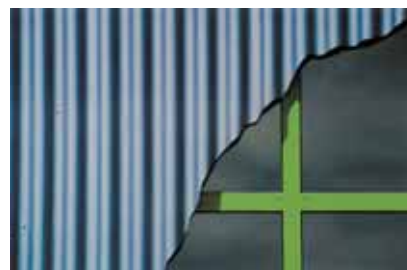
Roland Heinzl, Grünes Kreuz / Zelený kříž