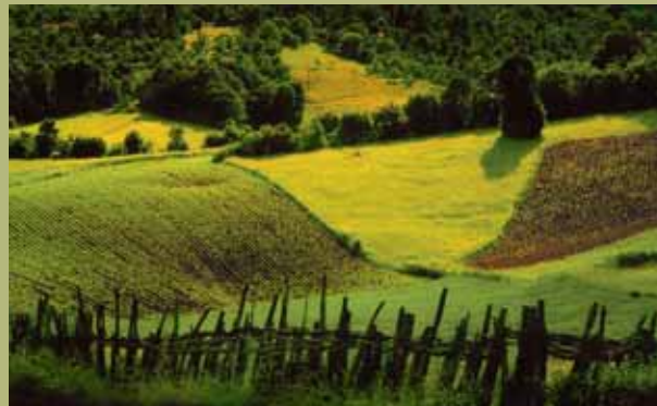
Marko Tanaskovic, Wiev 2 / Pohled 2