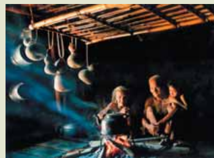
Do Dien Khanh, The fish market skirt the coast / Rybí trh u pobřeží, Vietnam / Vietnam