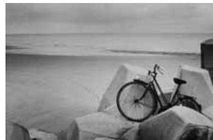
Bob Ceusters, Water fiets, Belgium / Belgie