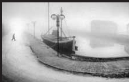
Shadows in the fog 2 / Stíny v mlze 2