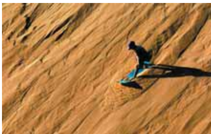
Le Bu, Quicksand pleasures / Radosti v písku, Vietnam / Vietnam