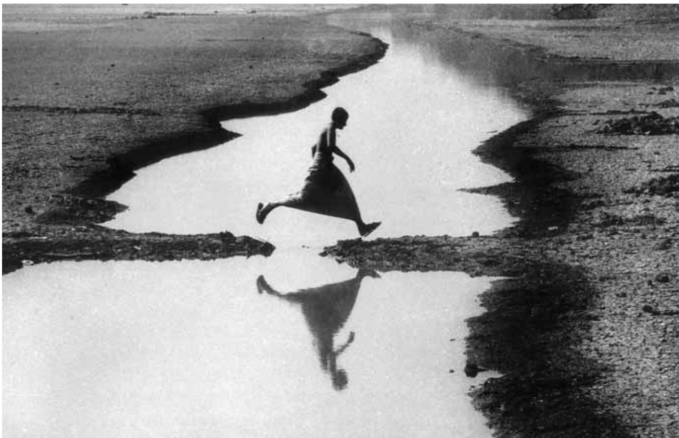
Paul Probal, Overcome / Přeskok, India / Indie