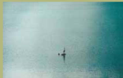
Zoran Plamenac, Water 2 / Voda 2