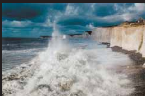
Maurilio Teso, ARPS, The splash / Špouchání, England / Anglie