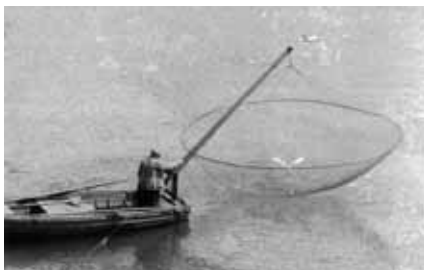
Vili Kuronen, AFIAP, Swedish Fisher / Švédský rybář, Finland / Finsko