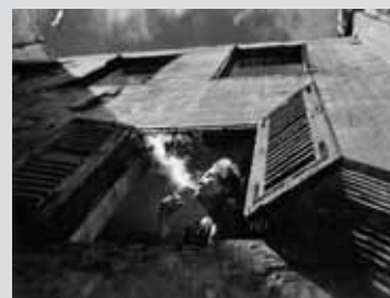
Hoang Trung Thuy , Missing / Chybějící , Vietnam / Vietnam