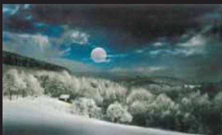
Miroslav Pindák, Zima na Valašsku / A winter in Wallachia