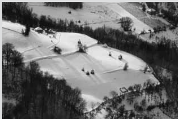
Vladan Tanasković, Fat hill 2 / Široký kopec 2, Serbia / Srbsko