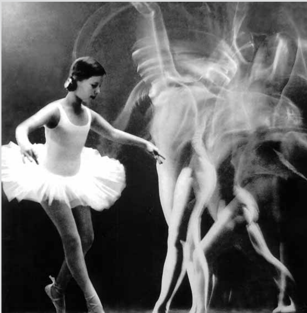
Little ballerina 3 / Malá balerína 3