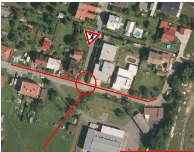
Místo překopu na křižovatce U měnírny.

Vlivem pokračující stavby přeložky na přívodním řádu VDJ Ústí – ČS Lužná, kterou realizuje společnost Vodovody a kanalizace Vsetín, bude omezen provoz na místní komunikaci U měnírny. Do místní komunikace bude postupně uloženo potrubí vodovodního řádu a provoz bude vlivem stavby omezen. V průběhu stavby nedojde k úplnému uzavření místní komunikace, pouze k uzavření křižovatky u měnírny v místě překopu komunikace, a to jen na nezbytně nutnou dobu. Práce na tomto úseku jsou plánovány od 22.7.2024.