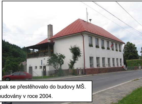
Sídlo OÚ bylo zpočátku v klubovně na hřišti, pak se přestěhovalo do budovy MŠ. Současné prostory OÚ byly vybudovány v roce 2004.