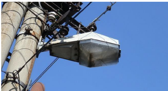
Stávající typ svítidel v obci Elektrosvit 444 1970 – Rakev

Svítidlo se stále vyrábí, ale jeho počátek technického vývoje spadá do 70. let minulého století a od té doby se upravovalo jen minimálně. Technická úroveň světelně činné části odpovídá rovněž datu uvedení na trh. Svítidla jsou vybavena neefektivními zdroji 70 a 125 W. Jedná se o anachronický, přežitý koncept svítidla.