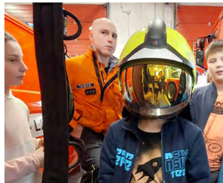
SKAUTI výprava do hasičárny a další akce tachlovických Hlavonožců

PROSINEC 2022 /XXIII. ročník / 114. číslo