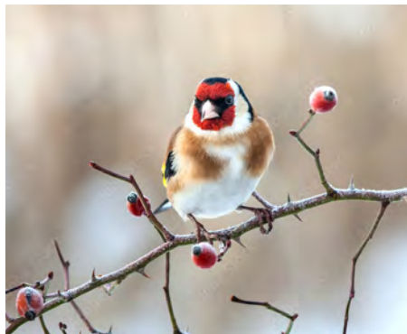
PŘÍRODA jak správně krmit ptáky v zimě a neublížit jim