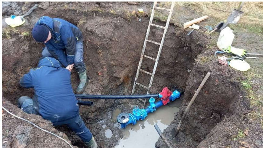
Montážní práce při opravě vodovodního uzlu Nad Viaduktem

byl podrobně přebrán archiv stavební dokumentace. Z výkresů a jiných dokumentů se podařilo vytěžit další užitečné informace o postupném vývoji vodovodu i kanalizace od roku 1950. Řadu cenných informací získáváme i z řad obyvatel, kteří se s námi o své vzpomínky a znalosti podělí. Technická mapa se stala velmi efektivním nástrojem pro provoz, včetně plánování údržby. Ukázala se použitelná jak pro výkaznictví směrem ke státní správě, tak pro polohopisnou a evidenční identifikaci vodárenského majetku města.