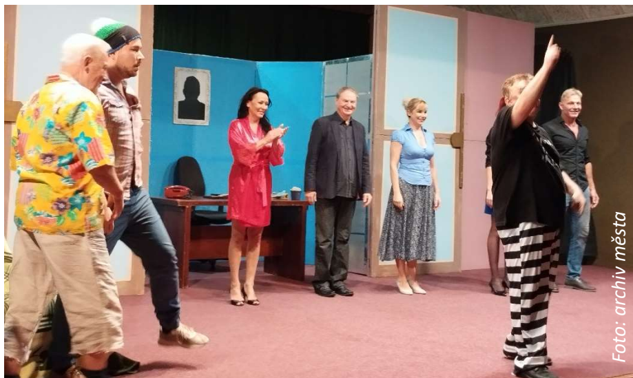
Závěrečná děkovačka herců divadelní komedie Kšanda před zcela zaplněným sálem v kině Na Rychtě.