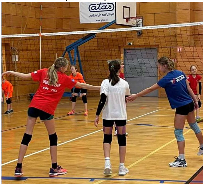
Trenéři volejbalové mládeže