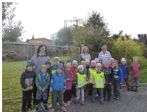
Děti z MŠ – oddělení Kačenky