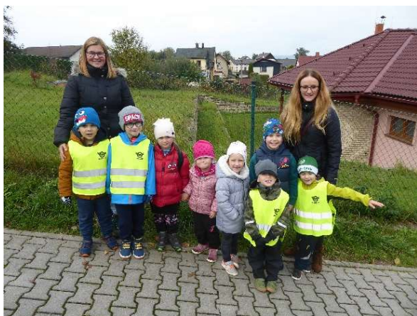
Děti z MŠ – oddělení Želvičky

Cesta tentokrát opravdu vedla po stopách klasických pohádek . Děti čekalo osm zastavení, na kterých se seznámily se známými pohádkami a zároveň plnily rozmanité úkoly. O program měly zájem jak děti z mateřské školy tak žáci první třídy ZŠ.