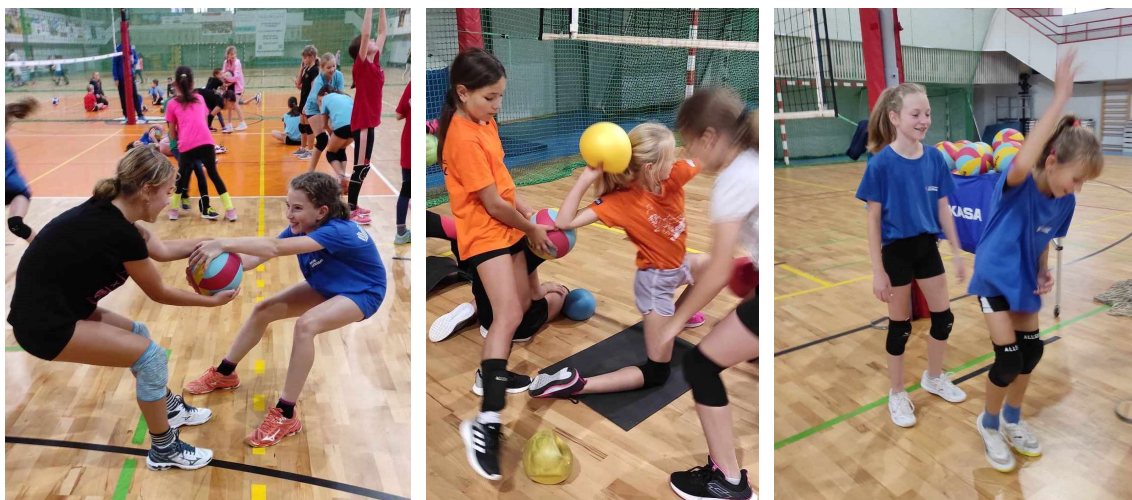
Trenéři volejbalové mládeže

Ve dnech 23. - 24. 10. 2023 se 8 hráček zúčastnilo kempu vedeného reprezentačními trenéry v Hradci Králové. Trénovaly především přihrávku a útočný úder, ale nechyběla ani kondice a kompenzace. Inspiraci čerpali i 2 trenéři Rtyně.