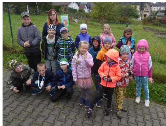
Děti ze ZŠ – 1. B třída