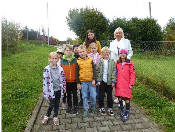
Děti ze ZŠ – 1. A třída