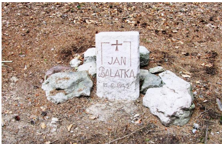
Jan Balatka na soudobé fotografii a pomníček v místě, kde si vzal život

Naskytla se však naděje v podobě odjezdu za prací do Říše. Jenže odjezd se neustále protahoval a Balatka čekání na další transport nevydržel. Nervově se zhroutil a 15. června 1942 se v lese Krákorka u Červeného Kostelce oběsil.