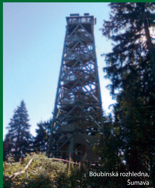
Boubínská rozhledna, Šumava