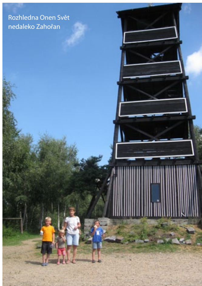
Rozhledna Onen Svět nedaleko Zahořan

Možná taky může být někdo v Zahořanech překvapený, že vyrostla hromada za brodem. Neděste se, nedělají si silnice u nás skládku. Je to frézovačka, kterou jsme získali pro opravy obecních cest. Mohla by