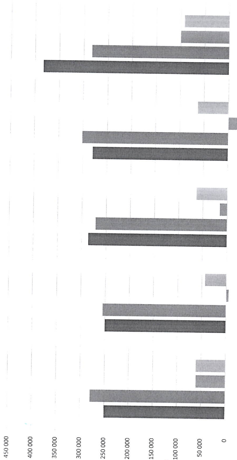
Graf vývoje příjmů a výdajů v letech 2019 - 2023 v tis. Kč