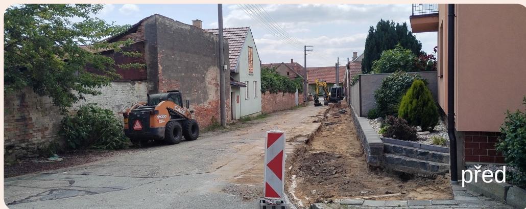
Rekonstrukce ulice Vinohradská (Michálkova)