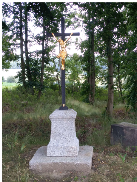
Křížek nad Daměnicemi

Výstavba společenského domu v Horní Lhotě: v květnu se venkovní zárubně osadily dveřmi, udělal se obklad v kuchyni (u budoucí kuchyňské linky) a obložilo se celé sociální zařízení. Vnitřní prostory jsou jednou vybičeny. V sociálním zařízení se pokračuje pokládkou dlažby.