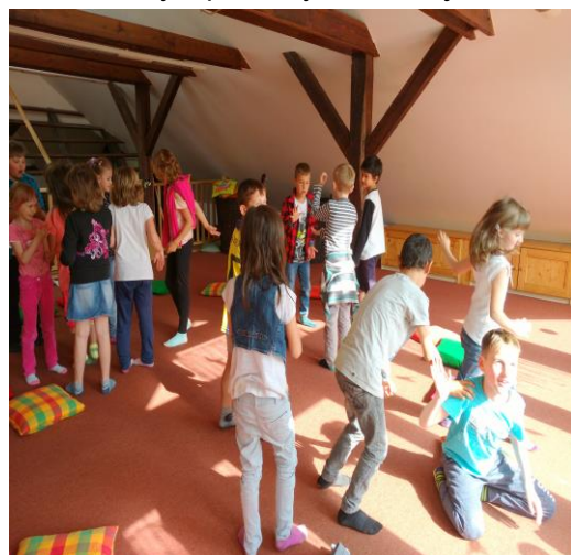
Učitelky a žáci 1. a 2. třídy ZŠ

Pořad s názvem „Mrňouskové kolem nás“ pojednával o hmyzu. Dětem se nejvíce líbily soutěže, tanečky a promítání o životě broučků. Dopoledne jsme zakončili hřítkami v zámeckém parku. Už nyní se těšíme na další návštěvu Ekocentra.