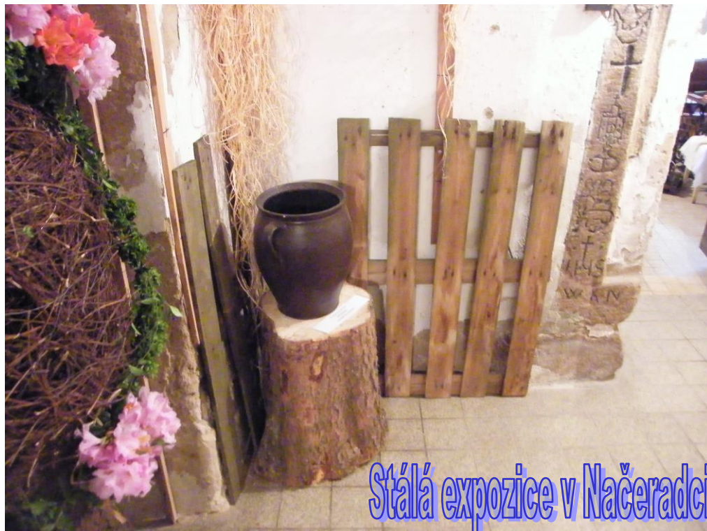
Stálá expozice v Načeradci