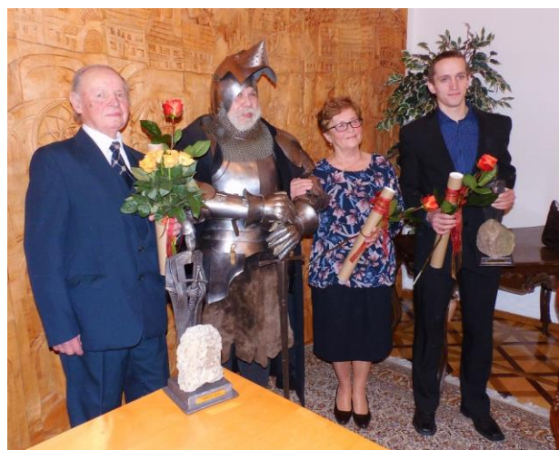
Foto: Společná fotografie loňských držitelů ocenění Blanický rytíř

ZO ČSOP Vlašim, Podblanické ekocentrum, Pláteníkova 264, 258 01 Vlašim zapsaná jako pobočný spolek pod sp. zn. L 49159 ve spolkovém rejstříku vedeném Městským soudem v Praze Tel./fax: 317 845 169, 317 845 965 E-mail: vlasim@csop.cz IČO: 185 95 677 Bankovní spojení: ČS a. s. Vlašim, 322 147 339 / 0800