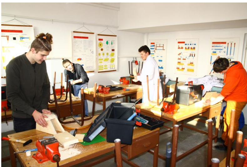
Foto: Žáci při výrobě ptačí budky.