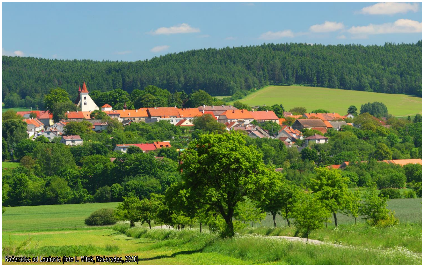
Načeradec od Louňovic