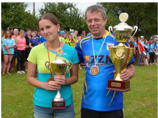
Agrodružstvu Načeradec a DAM-STAVBY Daměnice.

Druhé kolo letošního ročníku Benešovské hasičské ligy se konalo 2. července v Daměnicích. Soutěž "O pohár SDH Daměnice" byla již pátým ročníkem této soutěže, konala se jako obvykle na 2B, kdy muži a ženy mají jak společnou trať tak i společnou startovní listinu. Přijelo 29 mužských a 16 ženských družstev, z toho 3 družstva mužů a 2 družstva žen soutěžila ve slabší kategorii PS-12.