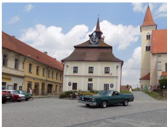
V Křížově 30.7.2016