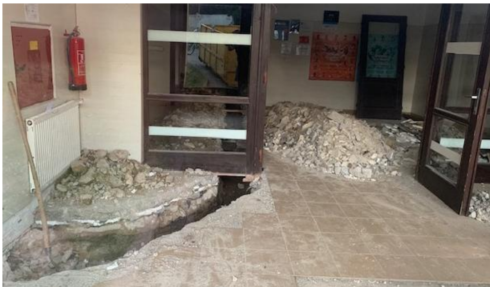
Rada městyse Načeradec