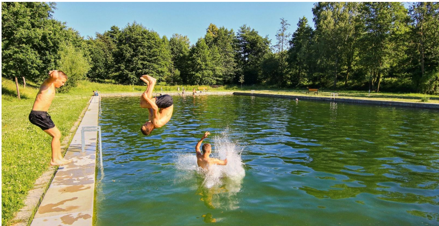
Léto na koupáku v plném proudu