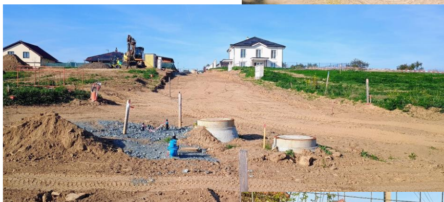
Byla zahájena výstavba komunikace a chodníku na nových parcelách v Načeradci