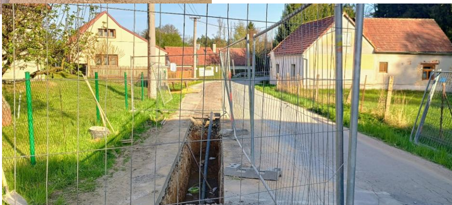
Byla zahájena výstavba nového vodovodu v Dolní Lhotě a v Novotinkách