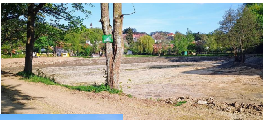
Pokračuje oprava a odbahnění rybníka Podsada