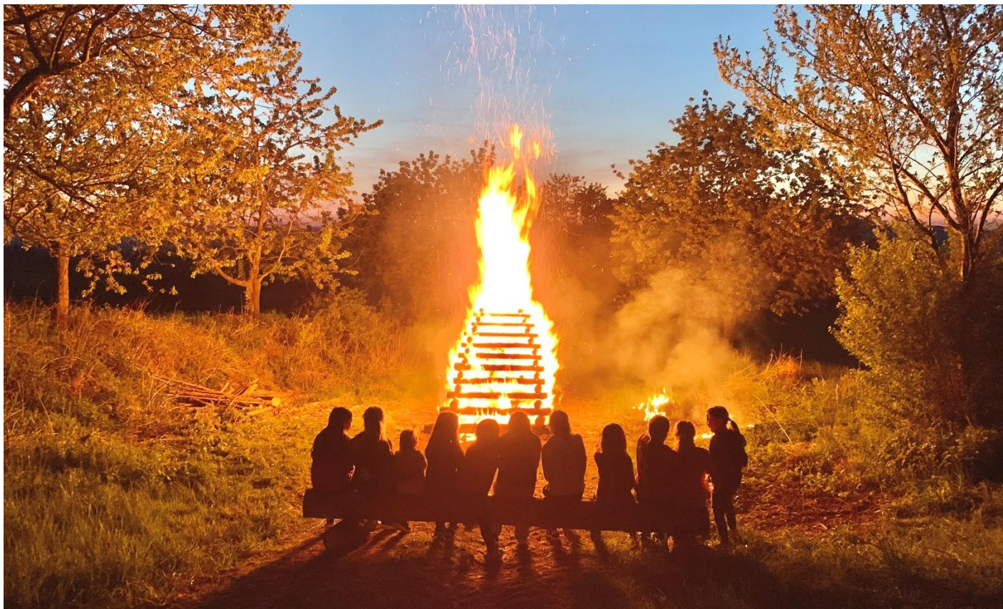
Jeden z ohňů 30.4. v Načeradci