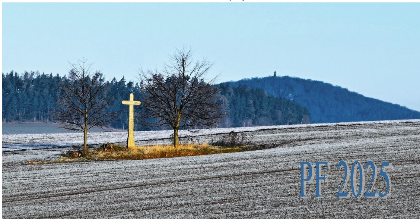
Křížek u Pravětíc