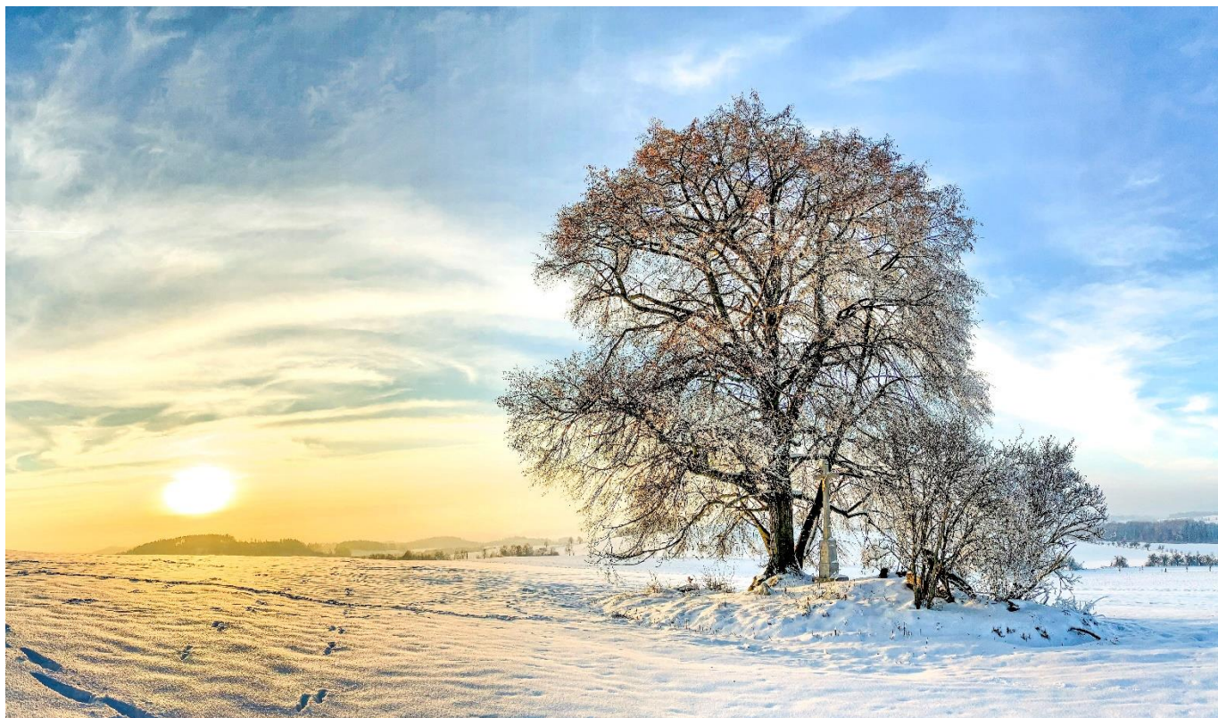
Křížek u Řísnice