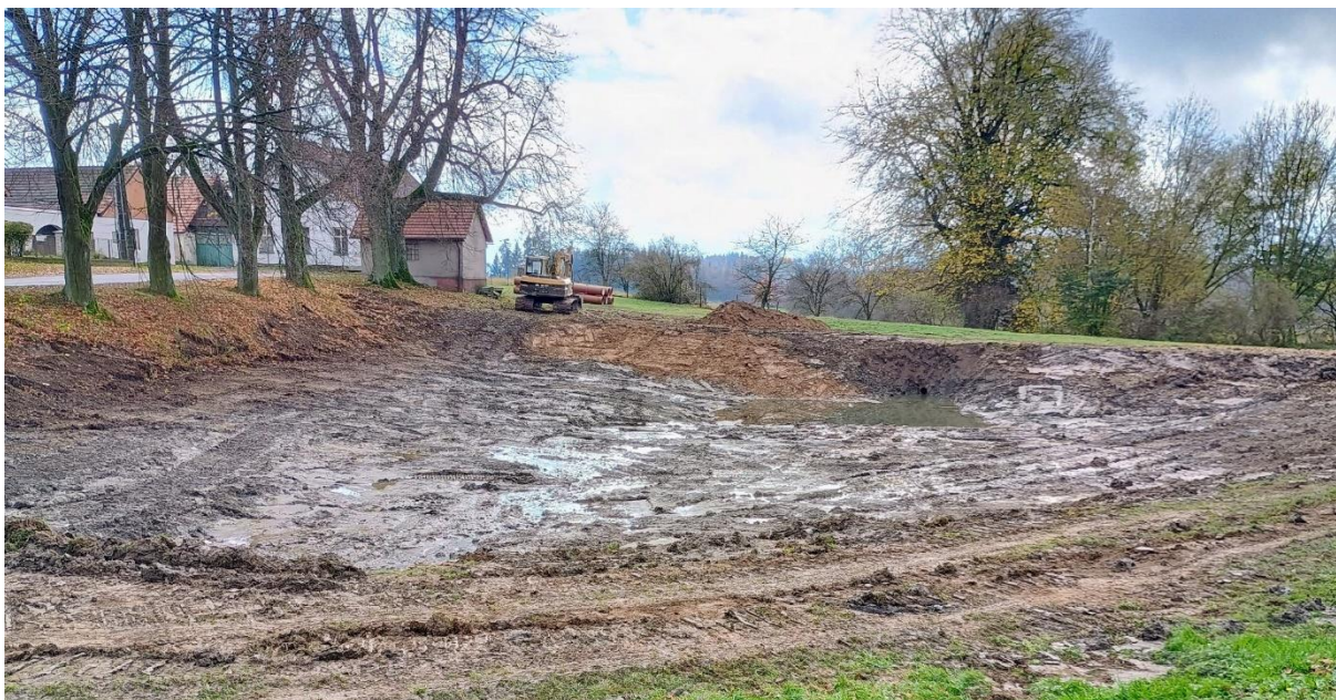
Byla zahájena rekonstrukce obecní vodní nádrže ve Zdiměřicích

Stav finančních prostředků k 31.10. 2024: