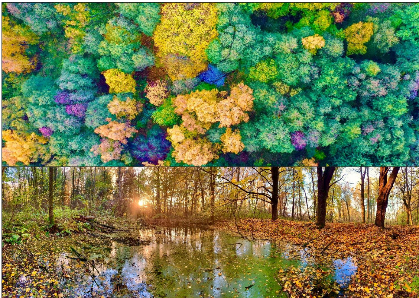
Stará zámecká koupadla u Olešné z ptačího pohledu i ze země