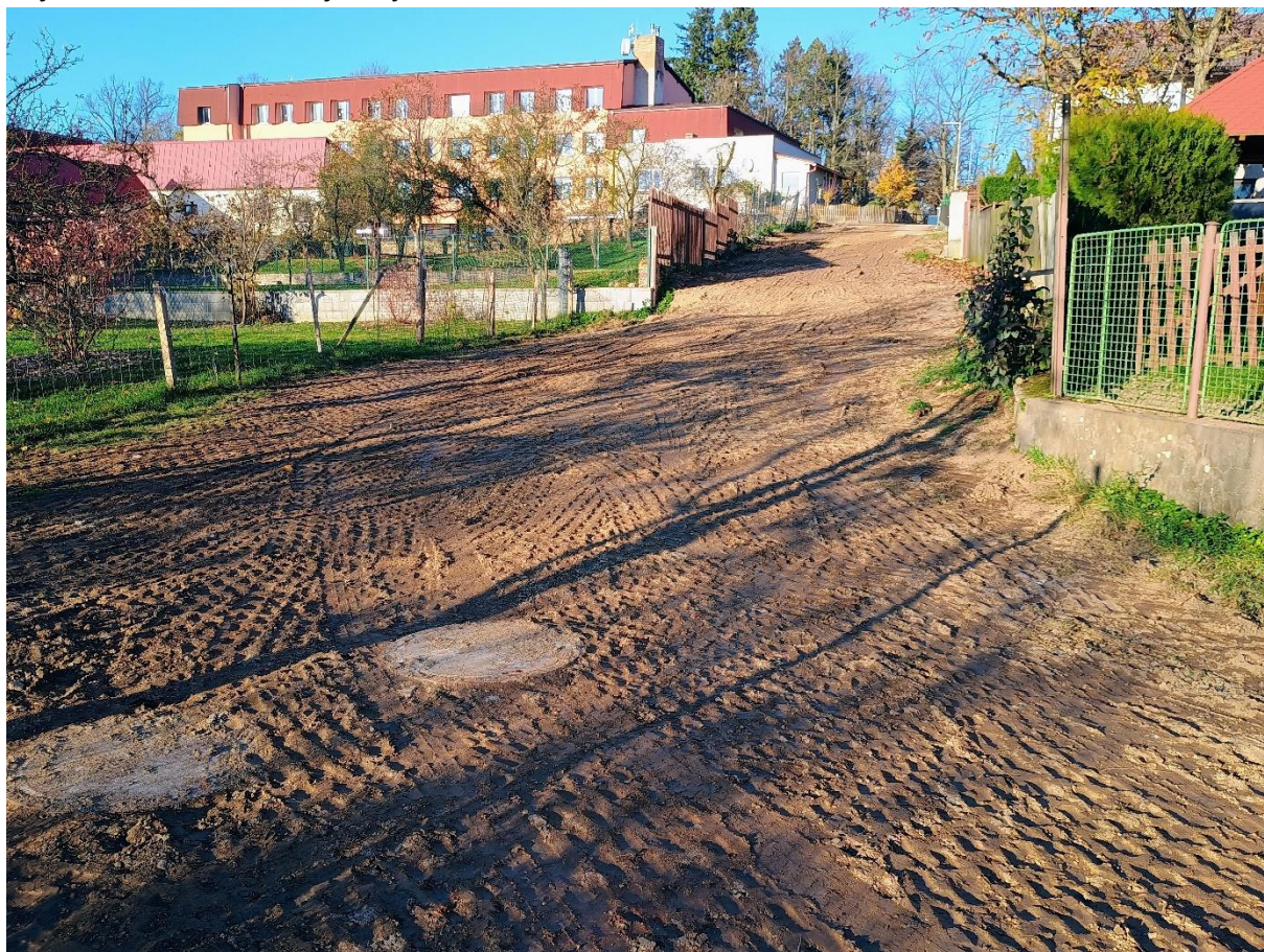
Byla dokončena výměna dešťové kanalizace v délce 121 metrů ze dvora ZŠ Načeradec do ulice Za Školou do ulice Dlouhá, Načeradec

Z probíhajících akcí v měsíci říjnu vybíráme: