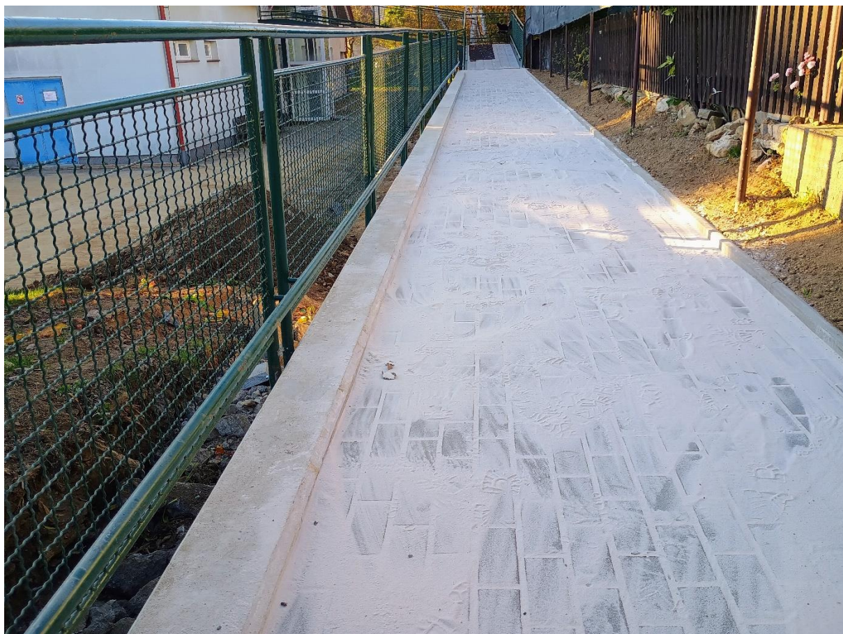
Dokončený bezbariérový vstup do Domu s pečovatelskou službou v Načeradci