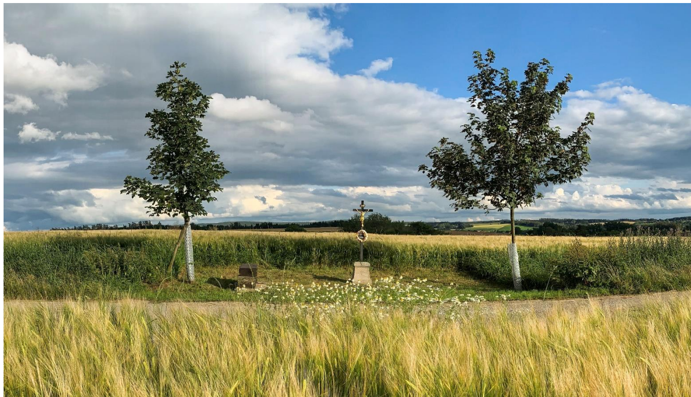
křížek u Horní Lhoty