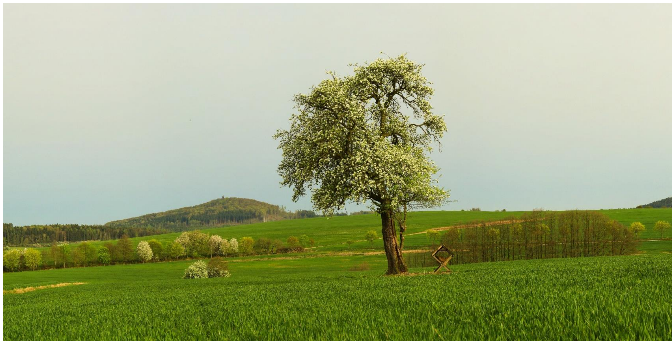
Hrušeň u Vračkovic